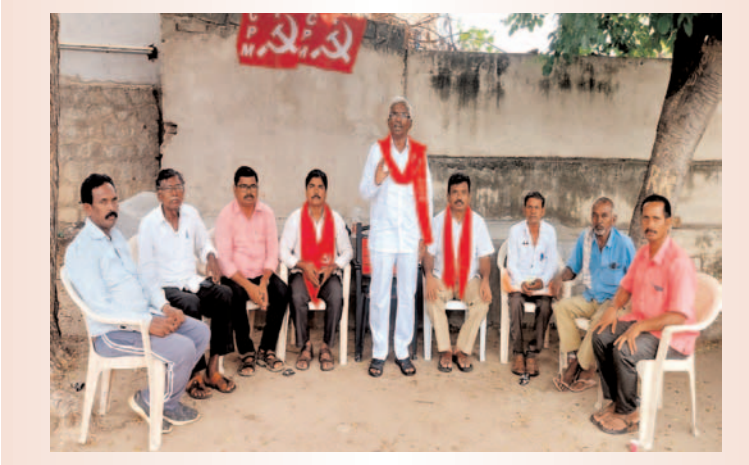
ప్రజా గొంతుకు స్యూస్ ప్రతినిధి/ షేక్ షాకీర్// నల్లగొండ జిల్లా// నార్కట్ పల్లి