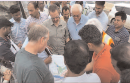
ప్రజా గొంతుక న్యూస్, సిహెచ్ రమణ ప్రతినిధి, పాలవరం

పాలవరం ప్రాజెక్ట్ ఎందుకు నిలిచిపోయింది నిర్మాణంలో అడ్డంకులు ఏమిటి పనులు తిరిగి ఎలాగా ప్రారంభించాలి అనే పై అంతర్జాతీయ నిపుణుల బృందం పరిశీలిస్తుంది. 4 రోజుల పర్యటన భాగంగా కావర్ డ్యాములు, డయా ప్రామ్ వాక్లను పరిశీలించిన అనంతరం పనులను పురోగతిపై నివేదిక ఇవ్వనున్నారు అంతర్జాతీయ న్యాయ పనులు బృందం పరిశీలిస్తుంది అమెరికా కెనడా నుంచి నలుగురు నిపుణులు వచ్చారు కేంద్ర రాష్ట్ర జలనరుల శాఖ అధికారులతో ఢిల్లీలో నిపుణులు బృందం సమావేశం అయ్యారు