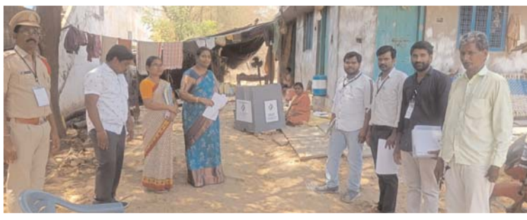
మొత్తం 78 మంది ఓటర్లకు పోస్టల్ బ్యాలెట్ మంజూరు చేయగా నేడు 44 మంది ఓటర్లు ఇంటి వద్దనే ఉండి తమ ఓటు హక్కు వినియోగించుకున్నారు. 4వ తేదీ మరియు 6 వ తేదీ లలో నిర్వహించనున్న హోంమ్ ఓటింగ్ ను మిగిలిన 33 మంది వినియోగించు కోవాలని ప్రకటనలో పేర్కొన్నారు.

సంక్షేమ భవన్ లో ఫెలిసిటీషన్ కేంద్రం ఏర్పాటు. ప్రజా గొంతుక స్టాఫ్/ ములుగు/ప్రతినిధి: కే ఆనీల్ కుమార్. ములుగు మే 3 : పార్లమెంట్ ఎన్నికల్లో విధులు నిర్వహించే ఉద్యోగులు పోస్టల్ బ్యాలెట్ ద్వారా ఓటు హక్కు వినియోగించుకోవాలని జిల్లా కలెక్టర్ ఇలా త్రిపాలి శుక్రవారం ఒక ప్రకటనలో తెలిపారు. పోస్టల్ బ్యాలెట్ పోలింగ్ కోసం ములుగు జిల్లా కేంద్రం లోని సంక్షేమ భవన్ లో ఫెలిసిటీషన్ కేంద్రం ఏర్పాటు చేశామన్నారు. ఈ నెల 4 తేదీ నుంచి 8వ తేదీ వరకు అర్హులైన ఉద్యోగు లందరూ పోస్టల్ బ్యాలెట్ ద్వారా ఓటు హక్కును వినియోగించుకోవాలని పేర్కొన్నారు. పోస్టల్ బ్యాలెట్ వినియోగించు కోవడానికి ఓటర్లు ఎన్నికల సంఘం నుండి విధంగా ఏదేని గుర్తింపుకార్డుతో పాటు ఓటర్ల స్లిప్లు వెంట తెచ్చుకో వాలని తెలిపారు. ఓటర్లు ఇబ్బంది పడకుండా నీడ కొరకు షామియానాలు, కుర్చీలు, మంచినీరు, ఫ్యాన్లు ఏర్పాటు చేశామన్నారు. ఉదయం 9 గంటల నుండి సాయంత్రం 5 గంటలకు వరకు పోస్టల్ బ్యాలెట్ వినియోగానికి సమయం కేటాయించినట్లు కలెక్టర్ తెలిపారు. ములుగు నియోజకవర్గంలో ఫారం 12 డి ద్వారా 85 ఏళ్ల వయసు పైబడ్డ వృద్ధులు, దివ్యాంగులు, ఎన్సైన్సియల్ ఓటర్లు