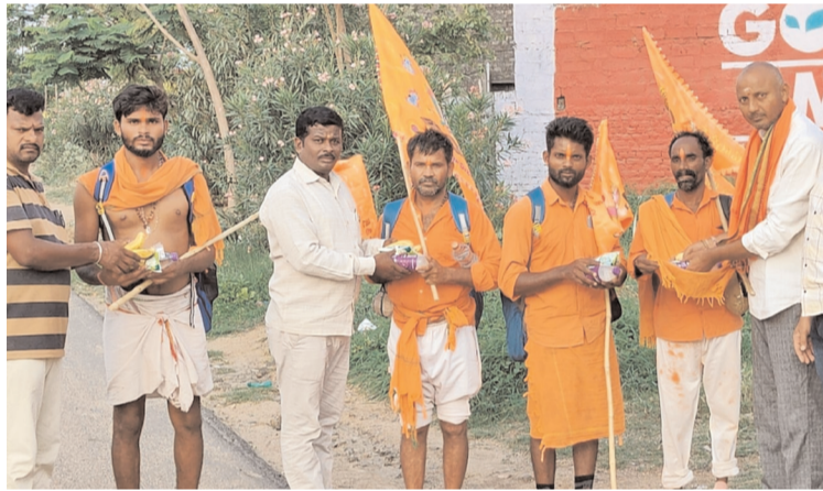
ప్రజా గొంతుక న్యూస్/ సుల్తానాబాద్