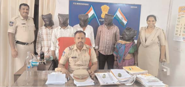
మనోహరాబాద్ 28మే(ప్రజా గొంతుకు)