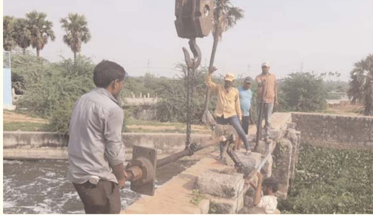
పలిగొండ మే 28 ప్రజా గొంతుకు ప్రతినిధి

పలిగొండ మండలంలోని భీమ లింగం కత్తు గేట్లు సాడిపోవడంతో వాటి స్థానంలో మూడు నూతన గేట్లను ఎమ్మెల్యే అనిల్ కుమార్ రెడ్డి తన సొంత నిధులతో ఏర్పాటు చేయడం పట్ల రైతులు హర్షం వ్యక్తం చేస్తూ కృతజ్ఞతలు తెలిపారు