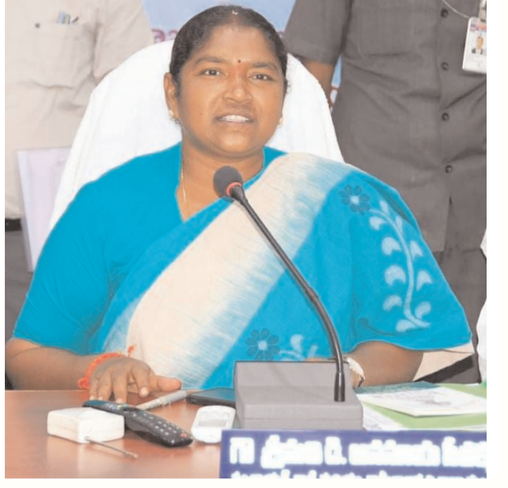
తో పాటు, ఈ ఎన్ సి లు, ఎన్ ఇ లు, ముఖ్య అధికారులు సమీక్ష లో పాల్గొన్నారు.