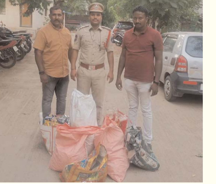
సుమారు రెండు లక్షల విలువ గుట్టా పట్టివేత