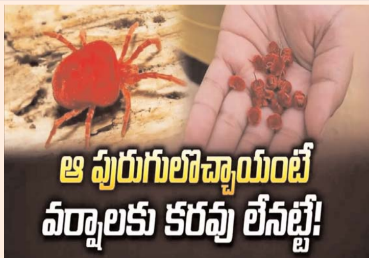
విన్నపిల్లలు వాటిని చూస్తూ ఆడుకోవడం మొదలుపెట్టారు. ఈ పురుగుల జీవితకాలం కూడా చాలా తక్కువే.

మొన్నటివరకు భానుడు తన ప్రతాపం చూపించాడు. వేసవి తాపంతో ప్రజలు అల్లాడిపోయారు. మొన్నటి నుంచే వర్షాలు కురవడం మొదలైంది. ఇక తాజాగా బంగాళాఖాతంలో అల్పవీడనం ఏర్పడే అవకాశం ఉందని వాతావరణ శాఖ హెచ్చరికలు జారీ చేసింది. ఈ క్రమంలో వాతావరణం చల్లచల్లగా మారుతోంది. ఇలాంటి సమయంలోనే ప్రకృతి తన అందాలను మనుషులకు పరిచయం చేస్తుంది. అందులో ఒకటి ఆరుద్ర పురుగులు. ఈ పేరు చెప్పితే మీలో చాలా మందికి తెలియకపోవచ్చు. కానీ, మనం చదువుకునే రోజుల్లో స్కూళ్లకి వెళ్లే సమయంలో ఇలాంటి పురుగులు ఎక్కువగా కనిపించేవి. ఎర్రని ఎరుపుతో ఒళ్లంతా ఒత్తుగా సింధూరం పూసుకున్నట్లు కనబడే మెత్తని మేను కలిగిన పురుగు ఆరుద్ర పురుగు. ఇవి చూడడానికి చిటికెన వేలు గోరంతే ఉంటాయి. వీటిని కొన్ని ప్రాంతాల్లో 'కుంకుమ పురుగులు' అని కూడా అంటారు. వర్షాకాలం ప్రారంభమయ్యే సమయాన్ని ఆరుద్ర కారై అంటారు. ఆరుద్ర కారై మొదలవగానే రైతులు వ్యవసాయ పనులు ప్రారంభిస్తారు. ఈ కారైలో మొక్కలపైనే, తడిసిన నేలపైన ఈ పురుగులు కనబడతాయి. అందుకే ఈ పురుగులకు ఆరుద్ర పురుగులు అనే పేరు వచ్చింది. కానీ ఇవి ప్రస్తుతం అంతరించే పరిస్థితి ఏర్పడింది. ఇవి సంవత్సరానికి ఒక్కసారి మాత్రమే కనిపిస్తూ ఉంటాయి. వర్షాలు మొదలవుతున్న ఇలాంటి తరుణంలో తాజాగా నిన్ను పంట పొలాల్లో ఈ పురుగులు కనిపించాయి. దీంతో స్థానిక ప్రజలు వీటిని నేలపై నుంచి విరుకుంటూ అరచేతిలో ఉంచుకుని సంబరపడ్డారు. ఇవి చూడటానికి ఎంతో అందంగా కనిపిస్తున్నాయి. దీంతో