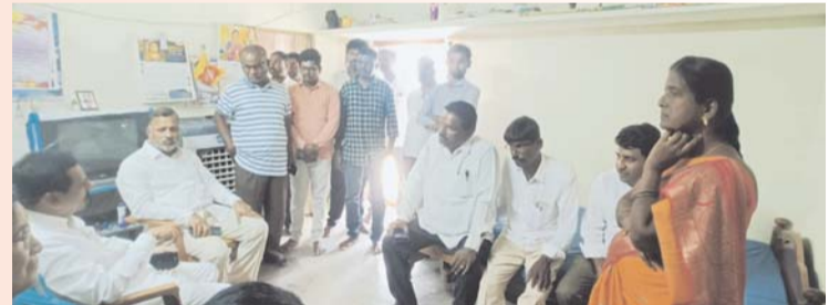
ప్రజా గొంతుక ప్రతినిధి/ డిండి: