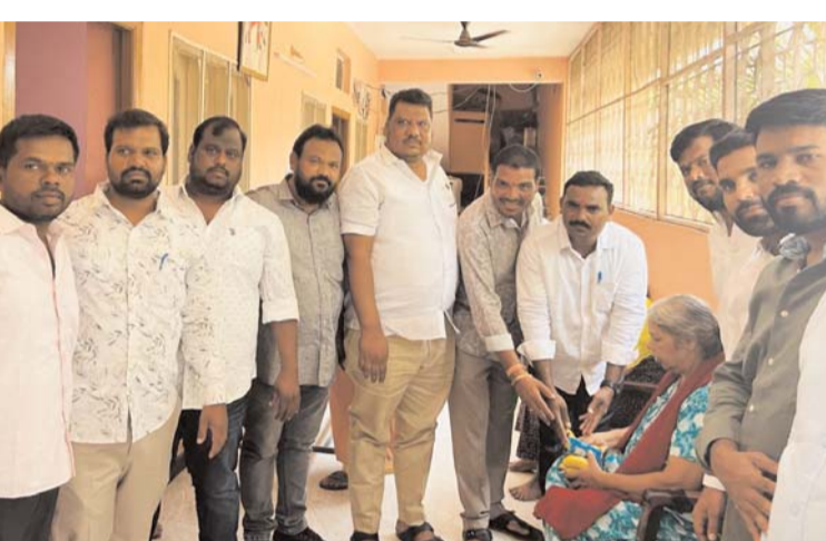
మరియా సదన్ పుద్గ ఆశ్రమంలో కాంగ్రెస్ నాయకుల ఆధ్వర్యంలో పుద్గలకు పండ్లు బిస్కెట్స్ ఆహారం పంపిణీ ప్రజా గొంతుక/తెలంగాణ బ్యూరో

కాంగ్రెస్ పార్టీ సీనియర్ నాయకుడు గుర్రం రణధీర్ రెడ్డి జన్మదినపు రోజున శనివారం శంషాబాద్ మండలం పెద్ద తూప్రా గ్రామంలో మరియా సదన్ పుద్గ ఆశ్రమంలో కాంగ్రెస్ నాయకుల ఆధ్వర్యంలో పుద్గలకు పండ్లు బిస్కెట్స్ ఆహారం పంపిణీ చేయడం