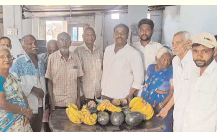
-మిత్రుడి వివాహ దినోత్సవం సందర్భంగా, పలు సేవా కార్యక్రమాలు చేసిన బొడ్డు ప్రవీణ్