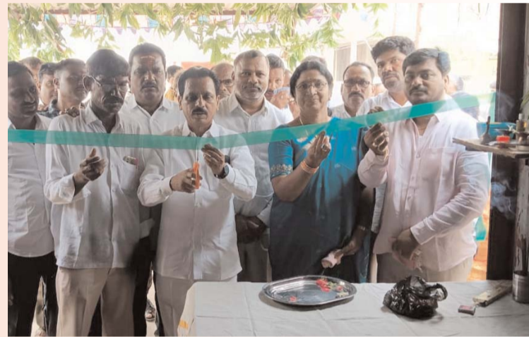
ప్రజా గొంతుక ప్రతినిధి/ డిండి: