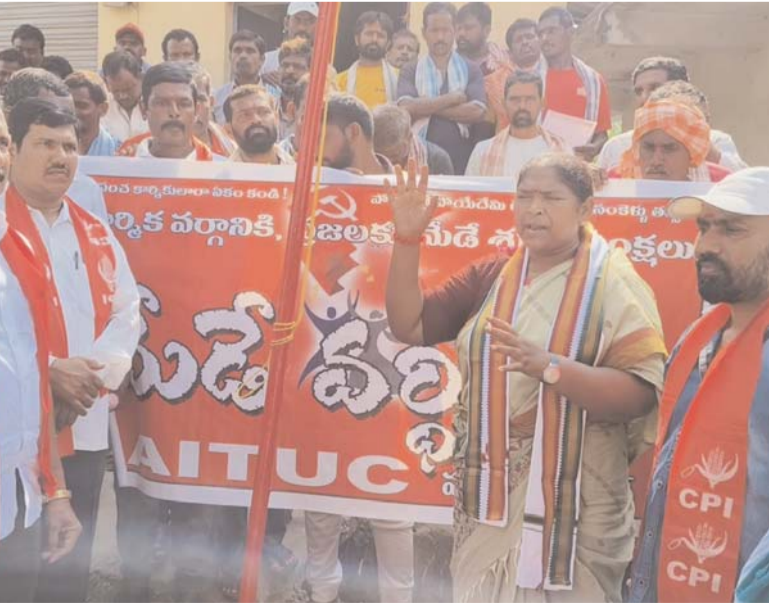
ఈ కార్యక్రమంలో ఏబిటియూసీ నాయకులు , కాంగ్రెస్ పార్టీ నాయకులు,కార్మికులు తదితరులు పాల్గొన్నారు.

దోపిడీ అంతంకావాలంటే వ్యవస్థ మారడం తప్ప వేరే మార్గం లేదు. దోపిడీ రహిత సమాజం కోసం ఎర్ర జెండాను ఎత్తిన అమరవీరులకు జోహార్లు అర్పించారు. మేడే కేవలం ఎనిమిది గంటల పనిదినం కోసమే కాదు. శ్రామికుల శ్రమ దోపిడీని అంతం చేయాలని, కార్మిక వర్గ రాజ్యం స్థాపించడం తప్ప చాలనే వారందరికీ స్ఫూర్తిని ఇచ్చేది మేడే అని, అందుకే ప్రపంచ కార్మికలారా ఐక్యం కండి. పోరాడితే పోయేదేమీ లేదు, బానిస సంకెళ్లు తెంచి ఐక్యంగా ఉద్యమించాలని పిలుపునిచ్చారు.