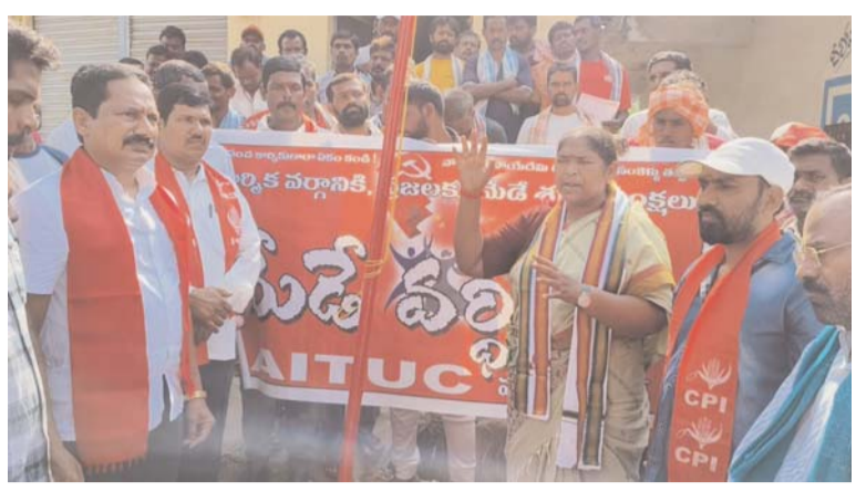
ప్రపంచ కార్మికలారా ఐక్యం కండి. పోరాడితే పోయేదేమీ లేదు, బానిస సంకెళ్లు తెంచి ఐక్యంగా ఉద్యమించాలని పిలుపునిచ్చారు. ఈ కార్యక్రమంలో ఏబిటియూసీ నాయకులు , కాంగ్రెస్ పార్టీ నాయకులు,కార్మికులు తదితరులు పాల్గొన్నారు.

దోపిడీ అంతంకావాలంటే వ్యవస్థ మారడం తప్ప వేరే మార్గం లేదు. దోపిడీ రహిత సమాజం కోసం ఎర్ర జెండాను ఎత్తిన అమరవీరులకు జోహార్లు అర్పించారు. మేడే కేవలం ఎనిమిది గంటల పనిదినం కోసమే కాదు. శ్రామికుల శ్రమ దోపిడీని అంతం చేయాలని, కార్మిక వర్గ రాజ్యం స్థాపించడం తప్ప చాలనే వారందరికీ స్ఫూర్తిని ఇచ్చేది మేడే అని,అందుకే