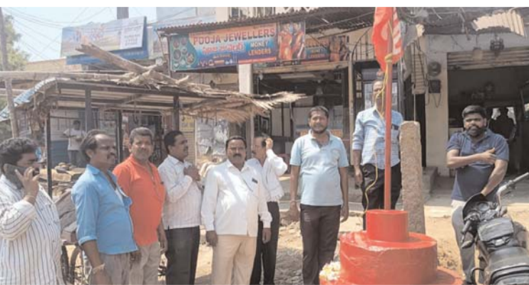
వలిగొండ మే 1 ప్రజా గొంతుక ప్రతినిధి