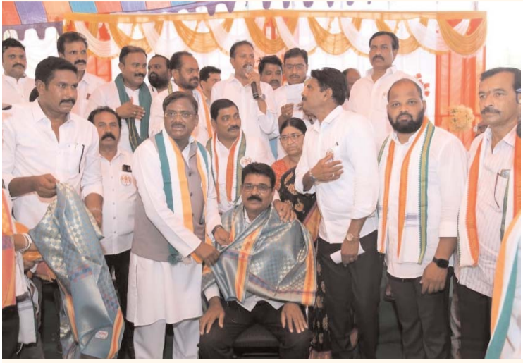
ప్రజా గొంతుక స్పూన్ :