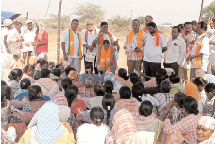
వలిగొండ మే 1 ప్రజా గొంతుక ప్రతినిధి :