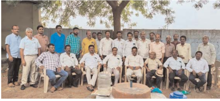
శ్రీరాంపూర్, సిసిసి, నస్సూర్ లలో ప్రథమ చికిత్స కేంద్రాల బండ్ ప్రజా గొంతుక స్పృహ ప్రతినిధి / మంచిర్యాల నియోజకవర్గం