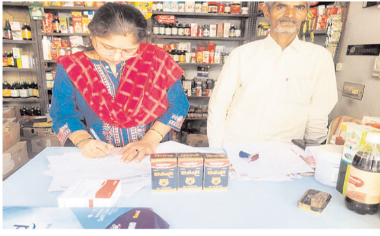
హైదరాబాద్ జిల్లాలో ఫుడ్ సేఫ్టీ అధికారులు తనిఖీలు నిర్వహించారు. జూబ్లీహిల్స్ లోని 36 డౌన్ టౌన్ బ్రూస్ పబ్ లో రూ.4,000 విలువైన ఆహార పదార్థాలు గడువు తీరినవి ఉన్నట్లు గుర్తించారు. ఆదే విధంగా మాకొ కిచెన్ అండ్ బారలో రూ.4,970 విలువైన కాలం చెల్లిన ఆహార పదార్థాలను పట్టుకున్నారు. జూబ్లీహిల్స్ లోని నేపూర్ల బస్ క్రీమ్ లో నరైన లేబులింగ్ లేకుండా బస్ క్రీంను రిఫ్రిజిరేటర్ లోపల స్టీల్ కంటైనర్లలో నిల్వ ఉంచుతున్నట్లు గుర్తించారు. వీరిపై చట్టపరమైన చర్యలు తీసుకోనున్నట్లు అధికారులు తెలిపారు.