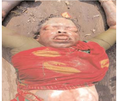
డిండి ప్రాజెక్టులో గుర్తుతెలియని మృతదేహం