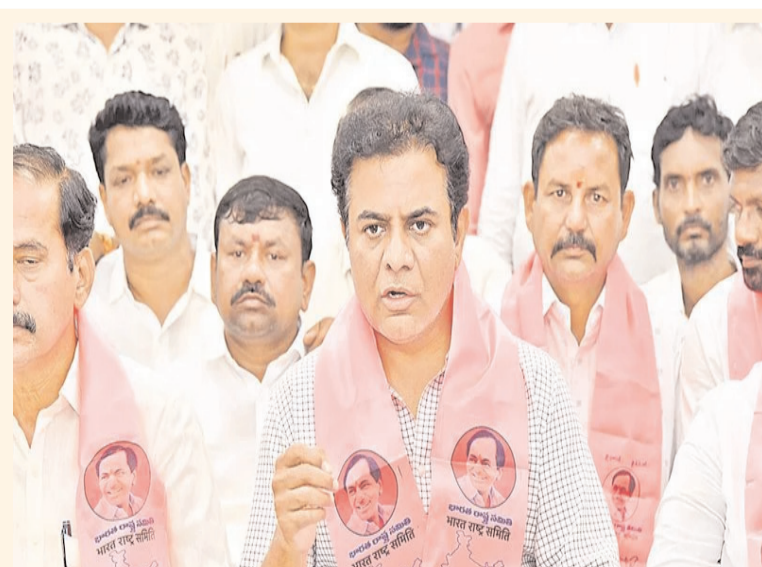
పార్టీల నాయకులు తెలంగాణ చుట్టూ గిరిగిరిల కొట్లకు తప్పని పరిస్థితిని కల్పించిందని పేర్కొన్నారు. ఈ ఎన్నికల్లో బీఆర్ఎస్ మంచి ఫలితాలు సాధించబోతున్నట్లు తెలిపారు. కాంగ్రెస్ పార్టీ వంద రోజుల్లో అమలు చేస్తామన్న ఆరు గ్యారంటీలను తుంగలో తొక్కడంతో ఆ పార్టీ పట్ల ప్రజల్లో తీవ్రవ్యతిరేకత కనిపించిందన్నారు. ఐదు నెలలుగా ప్రభుత్వాన్ని కాంగ్రెస్.. ట్రైంపానగా నడిపించిన తెలంగాణ. ఇక బీజేపీ తరఫున గత ఎన్నికల్లో నలుగురిని ఎంపీలుగా గెలిపించినా.. వారితో ఒరిగించేమీ లేదనే విషయం ప్రజలకు అర్థమైందన్నారు. కాగా, నల్లగండ్, ఖమ్మం, వరంగల్ జిల్లాల పట్టణ్లను ఎమ్మెల్యే ఉప ఎన్నిక నేపథ్యంలో బీఆర్ఎస్ ముఖ్యనేతలు, ప్రజాప్రతినిధులతో కేటీఆర్ బుధవారం తెలంగాణ భవనంలో భేటీ కానున్నారు.