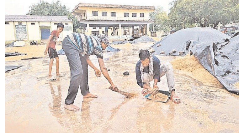
రోజులు వేచి చూడాల్సి వస్తోంది. కూలీల ఖర్చులు కూడా రైతులకు భారంగా మారుతున్నాయి.

సాధారణంగా వరి కోతలకు హాస్టల్లను వినియోగిస్తున్నారు. ఈ భారీ యంత్రం నేల తడిగా ఉంటే సడవదు. అకాల వర్షాల వల్ల రైతులు చైనీ మిషన్ తో వరి కొయించాల్సి వస్తోంది. ఇది నేల కాస్త తడిగా ఉన్నా పనిచేస్తుంది. ఇది వాడితే గంటకు రూ.1,500 చొప్పున అద్దె ఎక్కువ చెల్లించాల్సి వస్తోందని రైతులు వాపోతున్నారు. పైగా వర్షాలకు వరి చేలు తడిస్తే మూడు, నాలుగు రోజులు కోతలు వాయిదా పడుతున్నాయి. దీంతో ధాన్యం గింజలు నాణ్యత కోల్పోతున్నాయి. తడిసిన ధాన్యాన్ని ఆరబెట్టడానికి మూడు, నాలుగు