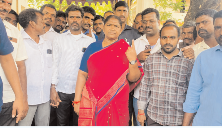
ప్రజాగొంతుక స్పూన్ /ములుగు/ ప్రతినిధి: కే అనిల్ కుమార్.

ములుగు మే 13: ములుగు మండలంలోని జగన్మూల గ్రామము లో ఓటు హక్కు వినియోగించుకున్న రాష్ట్ర పంచాయితీ రాజ్ గ్రామీణాభివృద్ధి, స్త్రీ శిశు సంక్షేమ శాఖ మంత్రి వర్మల దాక్షర్ దనసరి అనసూయ సీతక్క ఈ సందర్భంగా మాట్లాడుతూ రాష్ట్రములో మార్గదర్శన దేశం లో ప్రజలు మార్పు కోరుకుంటున్నారు. అని కులాల మధ్య, మతాల మధ్య చిన్న పెట్టి ఓట్లు దుందుకోవాలని చూసే పార్టీలకు ప్రజలు తమ ఓటు అనే ఆయుధంతో బుద్ధి చెప్పాలి. దేశములో ఇప్పుడు ఉన్న ప్రభుత్వం మళ్ళీ అధికారంలోకి వస్తే రాజ్యాంగాన్ని మారుస్తామని అంటున్నారు. ప్రజలు గమనించాలని అన్నారు. దేశములో కాంగ్రెస్ పార్టీ అధికారంలోకి రాబోతుంది అన్న వర్గాలకు న్యాయం జరుగుతుంది అని ప్రజలు కాంగ్రెస్ పార్టీని ఆశీర్వదించాలని విజ్ఞప్తి చేశారు. ఈ కార్యక్రమంలో కాంగ్రెస్ పార్టీ జిల్లా, మండల గ్రామ నాయకులు కార్యకర్తలు తదితరులు అన్నారు.