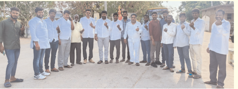
నారాయణపురం గ్రామంలో నాయకులతో నూకల బాలెడ్డి