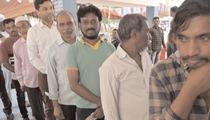
జాబ్ చేసిన 12 గుర్తింపు కార్డులతో ఏదైనా ఒక గుర్తింపు కార్డు తీసుకొని వచ్చి పోలింగ్ కేంద్రంలో తమ ఓటు హక్కును వినియోగించుకోవాలని కలెక్టర్ సూచించారు. మనం వేసే ఓటి మన భవిష్యత్తును నిర్దేశిస్తుందని, ప్రపంచంలోనే అతిపెద్ద ప్రజాస్వామ్య ఎన్నికలో మనమంతా భాగస్వామ్యం కావాలని, ప్రతి ఒక్క ఓటరు ఓటు వేయాలని ప్రజాస్వామ్యాన్ని సంగక్షించాలని కలెక్టర్ పిలుపునిచ్చారు.