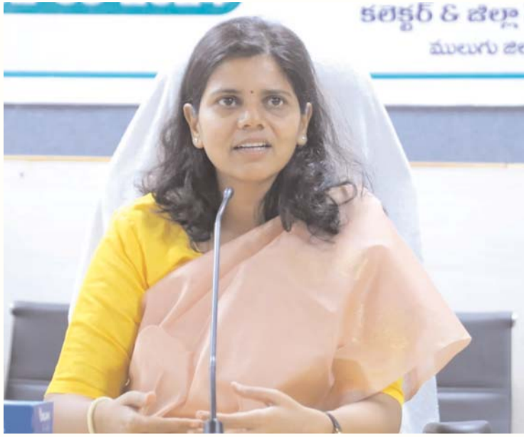
అన్నారు. మే 13న జరుగుతున్న పోలింగ్ లో ప్రతి ఒక్క ఓటరు తమ ఓటు హక్కును వినియోగించు కోవాలని జిల్లా కలెక్టర్ ఓ ప్రకటనలో తెలిపారు.

ములుగు అసెంబ్లీ సెగ్మెంట్ పరిధిలో 62 క్రిటికల్ పోలింగ్ కేంద్రాలు ఉన్నాయని, ఇక్కడ ప్రత్యేక చర్యలు చేపడుతున్నామని అన్నారు. జిల్లాలో ఎలాంటి వ్యూహాల పోలింగ్ కేంద్రం లేదని తెలిపారు. జిల్లాలో మొత్తం 87 లోకేషన్స్ లో 258 సీసీ కేంద్రాలు ఏర్పాటు చేశామని