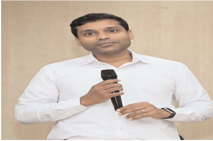
చేయలేదని పెద్దపల్లి పార్లమెంట్ ఎన్నికల రిటర్నింగ్ అధికారి ముజమ్మిల్ ఖాన్ ఆ ప్రకటనలో తెలిపారు.

పెద్దపల్లి పార్లమెంట్ నియోజకవర్గం పరిధిలో నిర్వహించిన తనిఖీలలో ఇప్పటి వరకు 2 కోట్ల 14 లక్షల 4 వేల 742 రూపాయలను జప్తు చేసి, సరైన ఆధారాలు పరిశీలించి గ్రీవెన్స్ కమిటీ 2 కోట్ల 8 లక్షల 13 వేల 242 రూపాయలను విడుదల చేసినట్లు పెద్దపల్లి పార్లమెంట్ ఎన్నికల రిటర్నింగ్ అధికారి ముజమ్మిల్ ఖాన్ ఆదివారం ఒక ప్రకటనలో తెలిపారు. మంధని అసెంబ్లీ సెగ్మెంట్ పరిధిలో 13 లక్షల 80 వేల 460 రూపాయలు, చెన్నూరు అసెంబ్లీ సెగ్మెంట్ పరిధిలో 12 లక్షల 96 వేల 750 రూపాయలు, బెల్లంపల్లి అసెంబ్లీ సెగ్మెంట్ పరిధిలో 61 లక్షల 77 వేల 722 , మంచిర్యాల అసెంబ్లీ సెగ్మెంట్ పరిధిలో 19 లక్షల 5 వేల 20 రూపాయలు సీజ్ చేయగా, ఆధారాలను పరిశీలించిన గ్రీవెన్స్ కమిటీ పూర్తి స్థాయిలో నగదును విడుదల చేయడం జరిగిందని అన్నారు. రామగుండం అసెంబ్లీ సెగ్మెంట్ పరిధిలో 33 లక్షల 44 వేల 790 రూపాయలు సీజ్ చేయగా, ఆధారాలను పరిశీలించి 32 లక్షల 14 వేల 790 రూపాయలు, ధర్మపురి అసెంబ్లీ సెగ్మెంట్ పరిధిలో 47 లక్షల 42 వేల 690 రూపాయలు జప్తు చేయగా, ఆధారాలను పరిశీలించి 45 లక్షల 42 వేల 690 రూపాయలు, పెద్దపల్లి అసెంబ్లీ సెగ్మెంట్ పరిధిలో 25 లక్షల 57 వేల 310 రూపాయలు జప్తు చేయగా, ఆధారాలు పరిశీలించి 22 లక్షల 95 వేల 810 రూపాయలు నగదును విడుదల చేశామని అన్నారు. సరైన ఆధారాలు సమర్పించని కారణంగా 5 లక్షల 91 వేల 500 రూపాయలు విడుదల