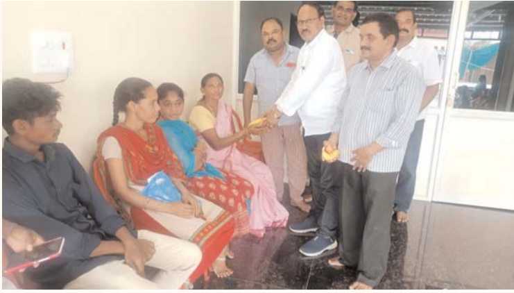
ప్రజా గొంతుకు స్పృహ ప్రతినిధి // చర్ర //