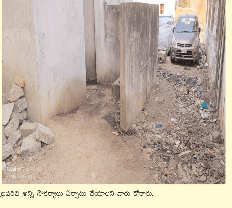
బ్రవరిచి అన్ని సౌకర్యాలు ఏర్పాటు చేయాలని వారు కోరారు.

మహిళలకు ఉచిత ప్రయాణంతో రద్దీగా బస్టాండ్ ప్రజా గొంతుక / బచ్చన్నపేట మండలం జనగామ జిల్లా, బచ్చన్నపేట మండల కేంద్రంలో ఆర్టీసీ బస్టాండు, లో కనీస వసతులు లేక ప్రయాణికులు ఇబ్బందులకు గురవుతున్నారు. తెలంగాణ రాష్ట్రంలో, మహిళలకు ఉచిత బస్సు ప్రయాణం ఉండటంతో బచ్చన్నపేట బస్టాండ్ రద్దీగా ఉంటుంది బస్టాండ్ వద్ద వేచి ఉండే మహిళలకు మరుగుదొడ్లు దుర్భాసన వచ్చి అందులో నీళ్లు లేక పరిశుభ్రంగా లేక ఇబ్బందులకు గురవుతున్నామని ప్రయాణికులు వాపోయారు. ఇప్పటికైనా ఉన్నతాధికారులు స్పందించి మరుగుదొడ్లను క్లీన్ చేయించి ప్రయాణికులకు అందుబాటులోకి వచ్చే విధంగా చూడాలని కోరుతున్నారు. ఎండాకాలం కావడంతో ఎండలు దంచి కొడుతుండగా, కనీసం మంచినీళ్లు కూడా బస్టాండు వద్ద అందుబాటులో లేవని, ప్రయాణికులు అంటున్నారు, అపరిశుభ్రంగా పడి ఉన్న వాష్ రూమ్లు దుర్భాసన వెదజల్లుతున్నారని వెళ్లే ప్రయాణికులు ఇబ్బందులు పడాల్సి వస్తోంది. బస్టాండ్, కు చుట్టుపక్క ఇండ్లలో నివాసముంటున్న వారికి తీవ్రమైన అసౌకర్యంగా ఉండడంతో, రోగాల బారిన పడుతున్నామని అపరిశుభ్రంగా ఉన్న మరుగుదొడ్ల, వల్ల మూత విసర్జనలు మరియు నీళ్లు లేక పనిచేయని కుళాయిలు ఉన్నాయి. మహిళలు తీవ్ర అసౌకర్యానికి గురవుతున్నారు. బచ్చన్నపేట నుండి హైదరాబాదుకు బస్సు సౌకర్యం ఏర్పడడంతో, బచ్చన్నపేట మండల కేంద్రానికి చుట్టుపక్క మండలాల ప్రయాణికులు గ్రామాల ప్రయాణికులు ఇక్కడ నుండి హైదరాబాద్ కు నిత్యం వందలాదిమంది ప్రయాణం చేస్తున్నారని, సౌకర్యాల లేకపోవడంతో, నాన్న అవస్థలు పడుతున్నారని ప్రయాణికులు వాపోయారు. ఇప్పటికైనా అధికారులు స్పందించి బస్టాండ్ కు