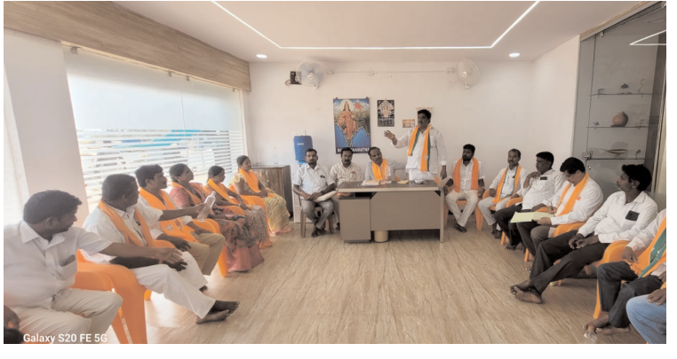
Galaxy S20 FE 5G