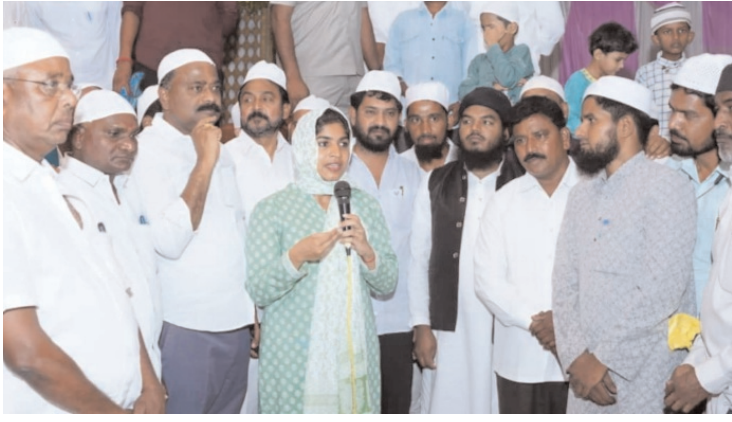
తొర్రూరు ఏప్రిల్ 8(ప్రజా గొంతుక )