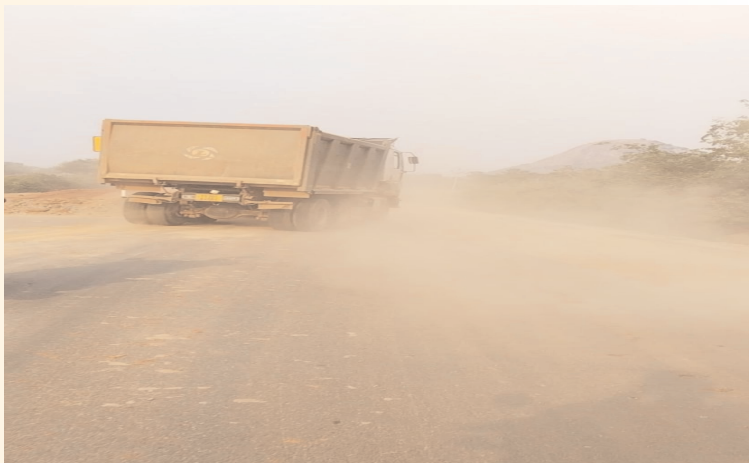
కాంట్రాక్టర్ నిర్లక్ష్యంతో ఇబ్బందులు పడుతున్న వాహనదారులు యాదాద్రి భువనగిరి జిల్లా ఏప్రిల్ 8 పరిగండ్ ప్రజా గొంతుక ప్రతినిధి