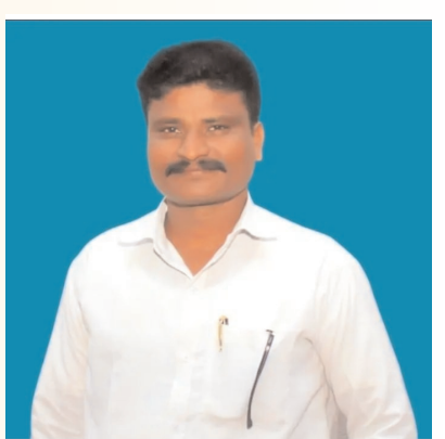
ప్రజా గొంతుక స్టాన్/ భద్రాద్రి కొత్తగూడెం జిల్లా/ప్రతినిధి