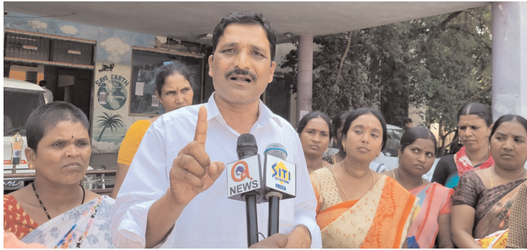
రాజేంద్ర నగర్ :ప్రజా గొంతుక