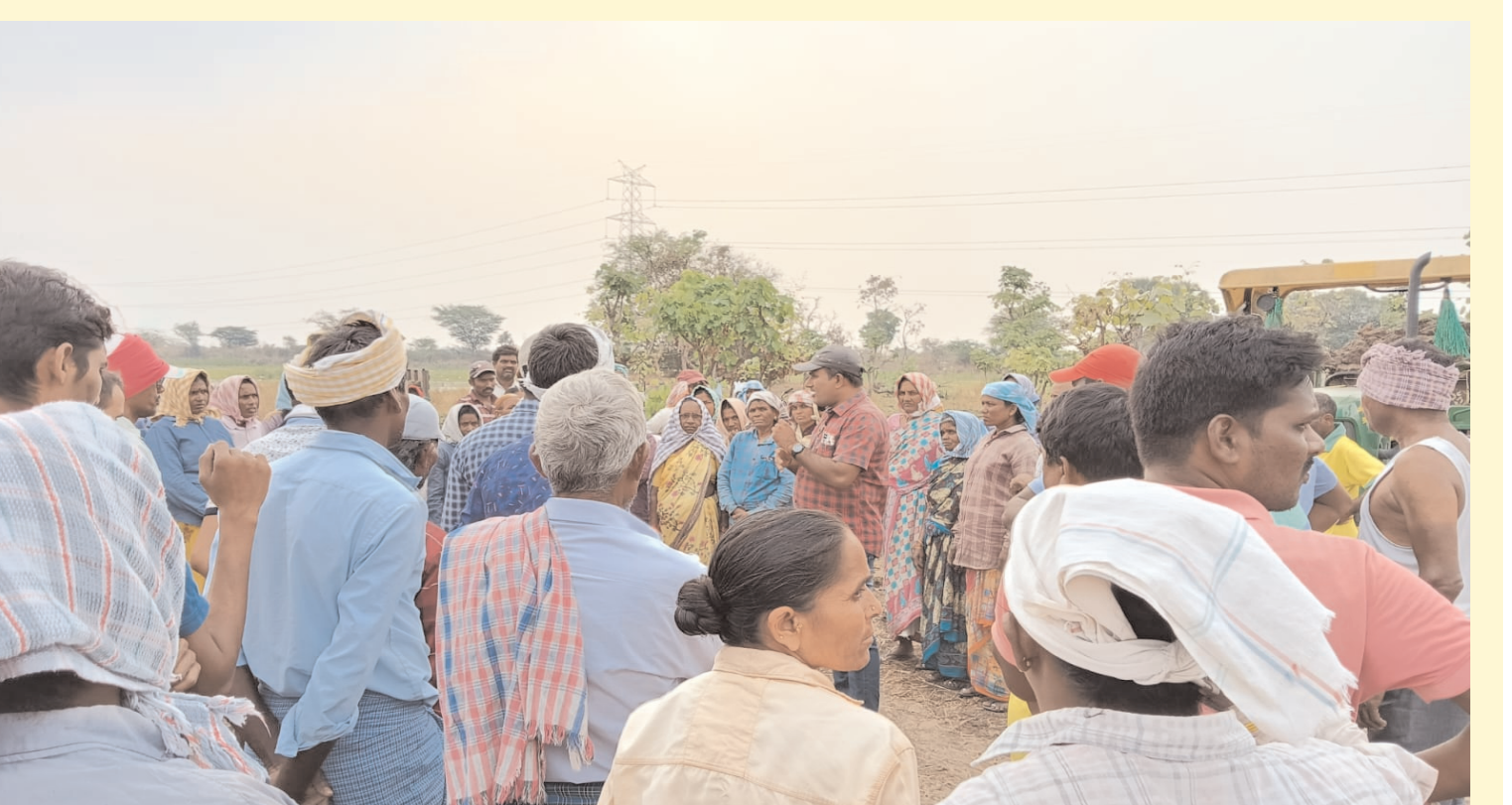
- గ్రామ కార్యదర్శి, కొత్త రాజారాం ప్రజా గొంతుక / శాయంపేట / 08/04/24

హనుమకొండ జిల్లా శాయంపేట మండలం పత్తిపాక గ్రామంలో చిర్రాకుంటలో జరిగే ఉపాధి హామీ పనిని పరిశీలించి షెడ్ నెట్ మరియు వాటర్ క్యార్డు ఏర్పాటు చేశారు ఈ సందర్భంగా కార్యదర్శి మాట్లాడుతూ జాబు కార్డు కలిగిన ప్రతి ఒక్కరూ నాలుగు గంటలు కొలతల ప్రకారం పనిచేస్తే ప్రతికూలికి 300 రూపాయలు చొప్పున వారి యొక్క అకౌంట్ లో ప్రభుత్వ