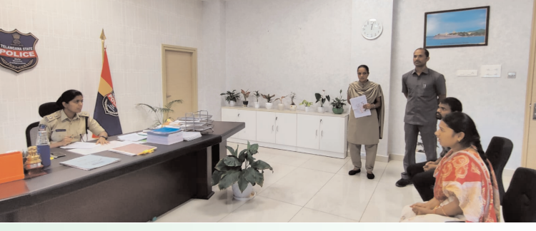
జిల్లా ఎస్పీ రక్షిత కె మూర్తి,

ప్రజా గొంతుక : వనపర్తి జిల్లావనపర్తి జిల్లా కేంద్రంలోనిశాంతిభద్రతల పరిరక్షణ లో భాగంగా ప్రజల సమస్యల పరిష్కారానికి పోలీస్ శాఖ చిత్తశుద్ధితో పనిచేస్తుందని బాధితులకు అండగా ఉంటూ ఫిర్యాదులపై వెంటనే చర్యలు తీసుకోవడం జరుగుతుందని జిల్లా ఎస్పీ రక్షిత కె మూర్తి, అన్నారు సోమవారం వనపర్తి జిల్లా పోలీస్ ప్రధాన కార్యాలయంలో ఎస్.పి రక్షిత కె మూర్తి, ప్రజావాణిలో కార్యక్రమాన్ని నిర్వహించారు జిల్లా ఎస్పీ ఫిర్యాదుదారుల సమస్యలను విని వాటిని చట్టప్రకారంపరిష్కరించాల్సిందిగా సంబంధిత అధికారులకు పలు సూచనలు ఇచ్చారు వనపర్తి జిల్లా నలుమూలల నుండి మొత్తం ఫిర్యాదులను 03 ఫిర్యాది దారులు రావడం జరిగింది.1.వరసూర్ గొడవలు 02భూ తగాదా ఫిర్యాదులు రావడం జరిగింది