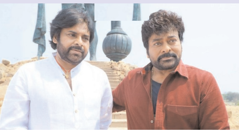
కళ్యాణ్ ఎన్నికల ప్రచారం త్వరలో పునఃప్రారంభం కానుంది. పవన్ కళ్యాణ్ తదుపరి టూర్ షెడ్యూల్ ఖరారు చేసే పనిలో జనసేనకులు ఉన్నారు.

ఎన్నికల ప్రచారంలో భాగంగా జనసేన అధ్యక్షుడు పవన్ కళ్యాణ్ అస్సలుతకు గురయ్యారు. ఈ క్రమంలో ఆదివారం పితావరం నియోజకవర్గం నుంచి హైదరాబాద్ చేరుకున్నారు. ఈ తరుణంలో శివార్లలోని ముచ్చింతల్లో నిర్వీరామంగా షూటింగ్ జరుపుకుంటున్న చిరంజీవి 'విశ్వంభర' షూటింగ్ లోకేషన్ కు వెళ్లారు. మరో సోదరుడు నాగబాబుతో కలిసి లోకేషన్ కు చేరుకున్న పవన్ కళ్యాణ్ కు చిరంజీవి ప్రేమపూర్వక స్వాగతం పలికారు.