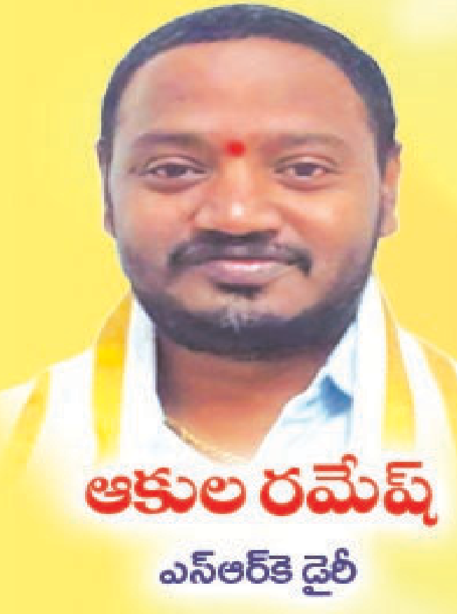
ఆకుల రమేష్ ఎస్ఆర్కె డైరీ