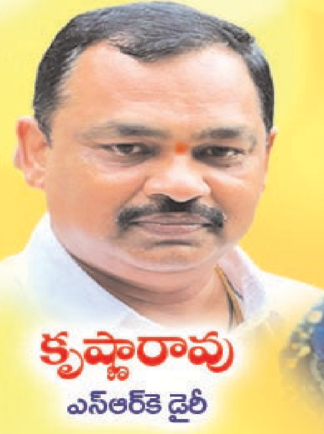
కృష్ణారావు ఎస్ఆర్కె డైరీ