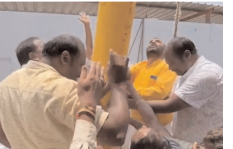
పకడ్బందీగా సమాధానం చేయాలని అన్నారు.

అభ్యర్థి అఫిడవిట్ ఫారం 26 లో పార్టీ పేరు, పార్లమెంటరీ నియోజకవర్గం పేరు, రాష్ట్రం పేరు, ఓటరు జాబితాలో పార్టీ, క్రమ సంఖ్య వివరాలు, పెండింగ్ క్రిమినల్ కేసులు వివరాలు, ఆస్తులు వివరాలు, అప్పుల వివరాలు, వృత్తి, విద్యార్హతలు, మొదలగు అన్ని వివరాలు