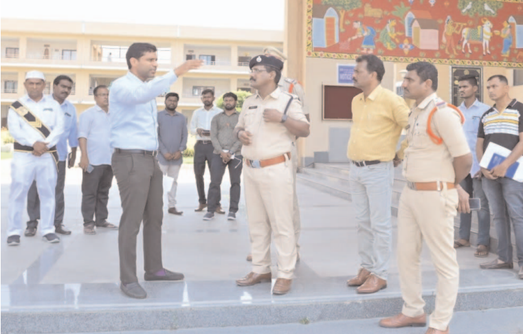
పోలీసు, సంబంధిత అధికారులు, తదితరులు పాల్గొన్నారు.