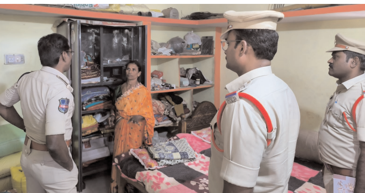
ప్రజా గొంతుక నెక్కొండ ప్రతినిధి