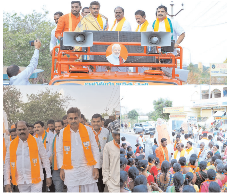
పెద్దపులి నాగారం గ్రామంలో ఘన స్వాగతం ప్రజాగొంతుక// ప్రతినిధి// మహేశ్వరం/ ఏప్రిల్ 12 (బిజినెస్ ట్రీకాంట్)