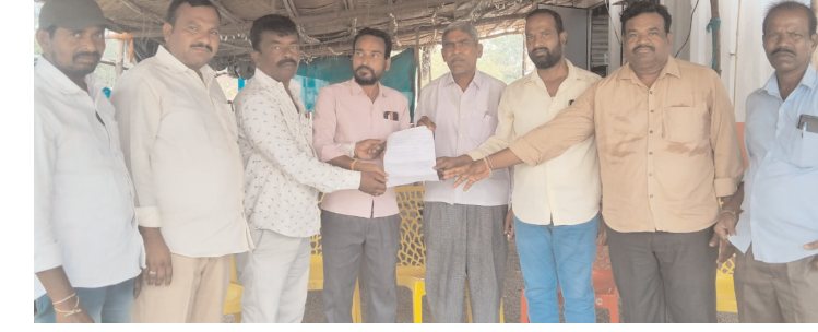
యాదాద్రి భువనగిరి జిల్లా ఏప్రిల్ 12 ప్రజా గొంతుక ప్రతినిధి