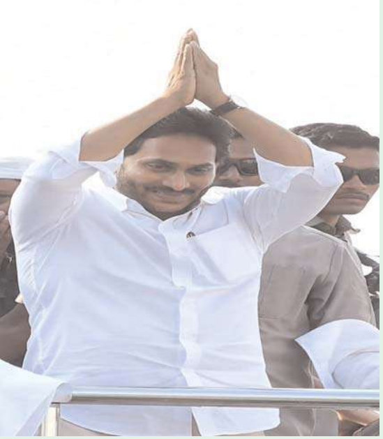
అమలు చేశామని చెప్పారు. 58 నెలలుగా చేస్తున్న అభివృద్ధిని కొనసాగించేలా ప్రజలు ఆశీర్వాదించాలని అన్నారు. ప్రజల ఆధారంగా వచ్చిన వైఎస్సార్ సీపీ ప్రభుత్వానికి మద్దతు ఇవ్వాలని కోరారు. వచ్చే ఎన్నికలు చంద్రబాబు మోసాలకు, ప్రజలకు జరుగుతున్న కురుక్షేత్ర యుద్ధం అని పేర్కొన్నారు. జరుగుతున్న మంచినీ కొనసాగించేందుకు మీరంతా సిద్ధమే

అంటూ సభకు హాజరైన ప్రజలను ఉద్దేశించి వ్యాఖ్యానించారు. చంద్రబాబు, దత్తపుత్రుడు, వదినమ్మ.. అందరూ అబద్ధాలు బుర్రకథలుగా చెబుతున్నారు. ఇదే కూటమి.. 2014లో ఇచ్చిన హామీలు ఒక్కటి కూడా నెరవేరలేదు. రంగు రంగుల మేనిఫెస్టో ఇంటింటికి వచ్చి.. హామీలు తుంగలో తొక్కింది కూటమియేనని దుయ్యబట్టారు. చంద్రబాబుకు ఓటేస్తే సంక్షేమ పథకాలన్నీ ఆగిపోతాయని హెచ్చరించారు. అలాగే చంద్రబాబుకు ఓటేస్తే సంక్షేమం ఆగిపోవాలని మీరు నిర్ణయం తీసుకున్నట్లీనీ కూడా హెచ్చరించారు. అదే ముగ్గురు మళ్లీ వస్తున్నారు.. ప్రజలారా జాగ్రత్త అంటూ ప్రసంగం కొనసాగించారు. సింగపూర్ నుంచి అభివృద్ధి చేస్తామని బాబు చెప్పారు.. కానీ జరిగిందా? అన్నారు. ప్రతి గ్రామానికి ఉమెన్ ప్రాజెక్ట్స్ ఫోర్స్ అన్నారు.. కానీ ఏర్పాటు చేశారా? అన్నారు. ఇంటింటికి ఉద్యోగం, నిరుద్యోగ భూతి అన్నారు.. కానీ చేశారా? అని అడిగారు. ప్రతి జిల్లాలో ప్లాట్ సిటీ కడతానన్నారు.. కానీ కట్టారా? రైతు రుణమోషీ చేస్తానన్నారు.. చేశారా? అని నిలదీశారు. పొడుపు సంఘాల రుణాలరద్దు చేస్తానన్నారు.. చేశారా? ఆడబిడ్డ పుడితే రూ. 25 వేలు డిపాజిట్ చేస్తానన్నారు.. చేశారా? అర్హులకు మూడు సెంట్ల స్థలం ఇస్తానన్నారు. ఇచ్చారా? 10 వేల కోట్లతో బీసీ సబ్ ప్లాన్ అన్నారు.. చేశారా? మళ్లీ అదే ముగ్గురు, కొత్త హామీలతో వస్తున్నారు జాగ్రత్త అని జగన్ అన్నారు. నూపర్ సిక్స్, సెవెన్ అంటున్నారన నమ్మొద్దు, ప్రజలు జాగ్రత్తగా ఉండాలన్నారు. మీరు నా స్టార్ క్యాంపెయన్లు మీరే. ఇంటింటికి వెళ్లి బాబు మోసాలను వివరించండి. పథకాలన్నీ కొనసాగాలంటే జగన్ నన్ను రావాలని చెప్పండి. వాలంటీర్లు మళ్లీ మీ ఇంటికి రావాలంటే జగన్ నన్ను రావాలి. జగన్ కు ఓటు వేయడమంటే మంచినీ కొనసాగించడమేనని పిలుపునిచ్చారు.