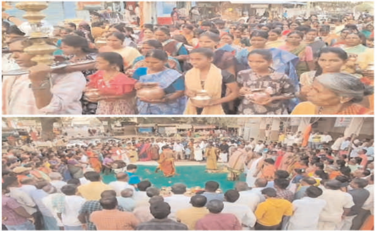
వివిధ ఆలయాల్లో ఆలయ కమిటీలు భక్తులకు ఎలాంటి ఇబ్బందులు కలగకుండా అనేక సదుపాయాలు కల్పించి, భక్తులకు తీర్థ ప్రసాదాలు వితరణ చేశారు.

చిన్న చింతకుంట మండలంలోని వడ్డేమాన్ రామలింగేశ్వర స్వామి ఆలయం, కొత్తకోట మండల పరిధిలోని కోటిలింగేశ్వర స్వామి ఆలయం, పామ హప్పురం శివాలయం, అద్దాకుల మండల పరిధిలోని కందూరు రామలింగేశ్వర ఆలయం%౪% మరియు మండలాల్లో ని వివిధ క్షేత్రాల్లో భక్తులు ఉపవాసాలతో బిల్వార్చన,లింగార్చన,రుద్రాభిషేకాలు చేశారు.హర హర మహాదేవ శంభో శంకర, ఓం నమశ్శివాయ అంటూ శివ వంచాక్షరీ ని స్తుతిస్తూ భక్తులు పరపశించిపోయారు. వివిధ ఆలయాల్లో శివనామ స్మరణతో ఎటు చూసినా ఓంకారనాధుని ధ్వనులే వినిపించాయి. వేలాది మంది భక్తులు జాగరణ చేసేందుకు దేవాలయాలకు వచ్చారు. గ్రామాల్లో పలు ఆలయాల్లో అనేక సాంస్కృతిక మరియు భజన కార్యక్రమాలు నిర్వహించారు. ఆ భ్రమరాంబాధుని వైభవాన్ని భక్తులు కనులతో వీక్షించి ఆధ్యాత్మిక అనుభూతిని పొందారు.