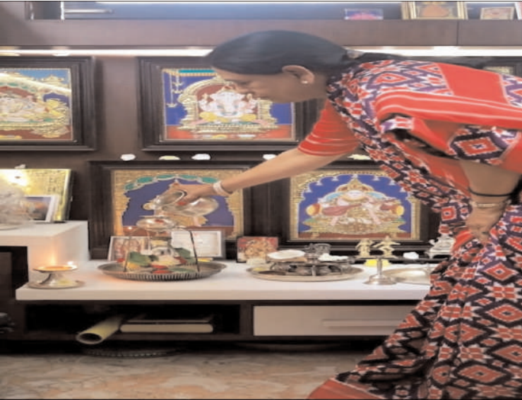
ప్రజా గొంతుక గద్దాల టౌన్.....

మహాశివరాత్రి సందర్భంగా బిజెపి జాతీయ ఉపాధ్యక్షురాలు డీకే అరుణమ్మ శుక్రవారం ఉదయం శివునికి అభిషేకం నిర్వహించారు. భక్తిశ్రద్ధలతో ఈ అభిషేకంలో ఆమె పాల్గొని పూజలు చేశారు. మహాశివరాత్రి సందర్భంగా ఆమె మాట్లాడుతూ భక్తిశ్రద్ధలతో పూజలు, ఉపవాసం, జాగరణలతో ఆ పరమశివుడిని ఆరాధిస్తున్న భక్తులు, ప్రజలందరికీ మహా శివరాత్రి శుభాకాంక్షలు తెలియజేశారు. ఆ పరమశివుని ఆశీస్సులు ప్రజలందరిపై ఉండాలని కోరుకుంటున్నట్లు ఆమె తెలియజేశారు.