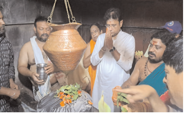
తెలుసుకున్నారు. శివరాత్రి సందర్భంగా వేలాల జాతరకు మంధని డిపో సుండి భక్తుల కోసం ఆర్డీసీ బస్సును ప్రారంభించారు.మంధని మున్సిపల్ కౌన్సిలర్ ఆధ్వర్యంలో ఏర్పాటుచేసిన మజ్జిగ ప్యాకెట్లను భక్తులకు పంపిణీ చేశారు