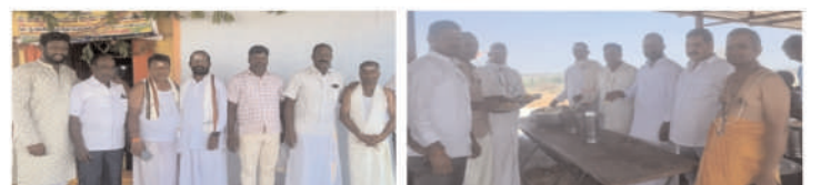
ప్రజా గొంతుక/ బచ్చన్నపేట మండలం