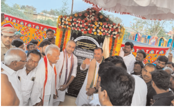
ప్రజా గొంతుక న్యూస్ గుర్తించాడు,