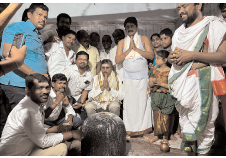
- చీటకోడూరు రామలింగేశ్వర స్వామి ఆలయంలో మార్చోగిన శివనామస్మరణ - ప్రత్యేక పూజల్లో పాల్గొన్న ఎమ్మెల్యే పల్లె