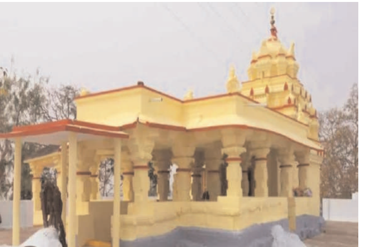
మాత్రం అలానే ఉండిపో యిందని భక్తులు పేర్కొంటున్నారు. ఇప్పుడున్న ప్రభుత్వం అయినా ఆలయ అభివృద్ధికి కృషి చేయాలని ప్రజలు కోరుకుంటున్నారు.

గోదావరి నది ప్రవాహం మధ్యలో ఓ గుట్టపై వేంచేసిన వీరభద్రస్వామి ఆలయం ఎంతో ప్రాచీన పురాతన ఆలయంగా ప్రసిద్ధి.తెలంగాణ రాష్ట్రంలోనే ఎక్కడా లేనటువంటి విధంగా గోదావరినది మధ్యలో ఉన్న ఏకైక ఆలయంగా ప్రసిద్ధి కెక్కింది. బూర్గంపాడు మండలం మోతె గ్రామానికి కొద్ది దూరానికి గోదావరి నది మధ్యలో ఈ ఆలయం ఉంది.గోదావరి సమీపం నుంచి సుమారు కి.మీ దూరంలో గుట్టపై ఈ ఆలయానికి చేరుకోవాలంటే నాలు పడవల చేరుకోవాల్సిందే.మోతెగడ్ల వీరభద్రుడు గిరిజనులకు అతి ప్రీతుడుగా కొలవడంతో ప్రతి శివరాత్రి వర్షదినాన జరిగే కళ్యాణ మహోత్సవాన్ని వీక్షించేందుకు అధికంగా భక్తులువస్తుంటారు.ఈ కల్యాణానికి రెండు తెలుగు రాష్ట్రాల ప్రజలతో పాటు చత్తీస్ గడ్, ఒడిశా రాష్ట్రాల నుంచి అధికంగా గిరిజనులు కల్యాణానికి తరలి రావడం ద్వారా గోదావరి నీటిప్రవాహంప్రమాదస్థాయికి మించి ప్రవహించినా ఆలయం పురాతన కాలం నుంచి ఇప్పటికీ ముంపుకుగురి కాలేదని పూర్వీకులు చెబుతుంటారు.ఇక్కడ కొలువున్న వీరభద్రస్వామి కళ్యాణంతో పాటు గిరిజనులు సంప్రదాయ పద్ధతుల్లో నేటికీ పూజలు కొనసాగుతున్నాయి. మోతెగడ్లవీరభద్రస్వామిగాభక్తులుకొలుస్తుంటారు.స్వామిని దర్శించేందుకు భక్తులు నాలు పడవలతో గోదావరి నదిని దాటి సదిమధ్యలో ఉన్న ఆలయాన్ని దర్శించుకుంటారు.కాకతీయాల కాలంలో ఈ ఆలయాన్ని నిర్మించగా ఈ ఆలయంలో స్వామి వారిని దర్శించుకునేందుకు భక్తులకు అనువైన పరిస్థితులను కల్పించడంలో పాలకులు వైఫల్యం చెందారనే విమర్శలు వస్తున్నాయి. ప్రభుత్వాలూ మారుతున్న ఆలయ అభివృద్ధి