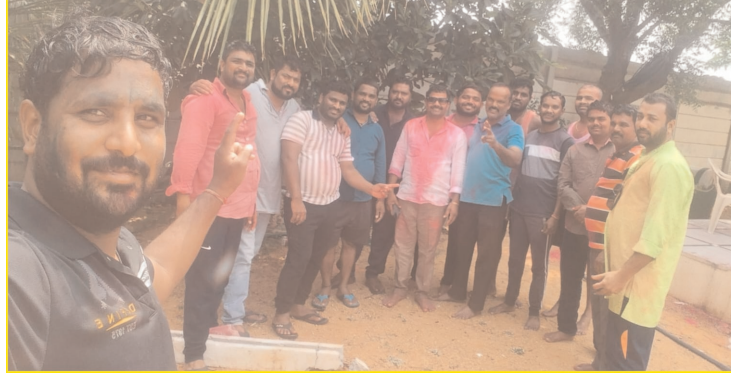
ప్రజాగొంతుకు/ప్రతినిధి/మహేశ్వరం/మార్చి25 (చిక్కిరి శ్రీకాంత్)

రంగారెడ్డి జిల్లా మహేశ్వరం మండలం పెద్దపులి నాగారం గ్రామంలో హెలికాప్టర్ వంతుగ అంగరంగ వైభవంగా పాల్గొంటున్న అతీతంగా నాయకులు ప్రజలు యువకులు కలర్స్ తో కన్నుల పండుగ గా జరుపుకున్నారు సోమవారం రోజున పెద్దపులి నాగారం గ్రామంలో చిన్నారులు మహిళలు యువకులు గ్రామ పెద్దలు ఈ యొక్క కార్యక్రమంలో పెద్ద సంఖ్యలో గ్రామస్థులు అందరూ పాల్గొని హెలికాప్టర్ వంతుగను ఎలాంటి సమస్యలు లేకుండా సామరస్యంగా హెలికాప్టర్ వంతుగను గ్రామ పెద్దలు అందరూ పాల్గొని ఒకరికి ఒకరు హెలికాప్టర్ వంతుగ శుభాకాంక్షలు తెలియజేసుకున్నారు.