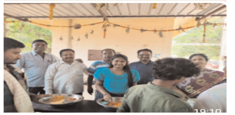
రూపాయలు చెల్లిస్తే ఆ దాత పేరుపై ఒకరోజు అన్నదానం చేయడం జరుగుతుందని తెలిపారు.