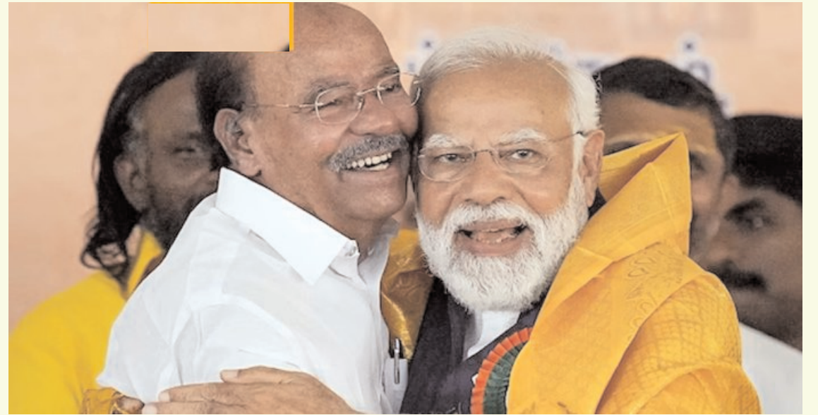
400కు పైగా ఎంపీ స్థానాల్లో పోటీ చేసే కూటమి అభ్యర్థుల విజయానికి దారితీస్తుందని బీజేపీ తమిళనాడు అధ్యక్షుడు కె.అన్నామలై ధీమా వ్యక్తం చేశారు

ప్రస్తుత రాజకీయ పరిస్థితులపై అసంతృప్తితో ఉన్న తమిళనాడు ప్రజలు మార్పు కోరుకుంటున్నారని, తమిళనాడులో తమ కూటమి భారీ విజయం సాధించి ప్రధాని మోదీ మూడోసారి బాధ్యతలు చేపట్టేందుకు మార్గం సుగమం చేస్తుందని పీఎంకే అధ్యక్షుడు అన్నుమణి ఆశాభావం వ్యక్తం చేశారు. ఎన్డీయేతో కలిసి పోటీ చేయాలన్న పీఎంకే నిర్ణయం దేశవ్యాప్తంగా