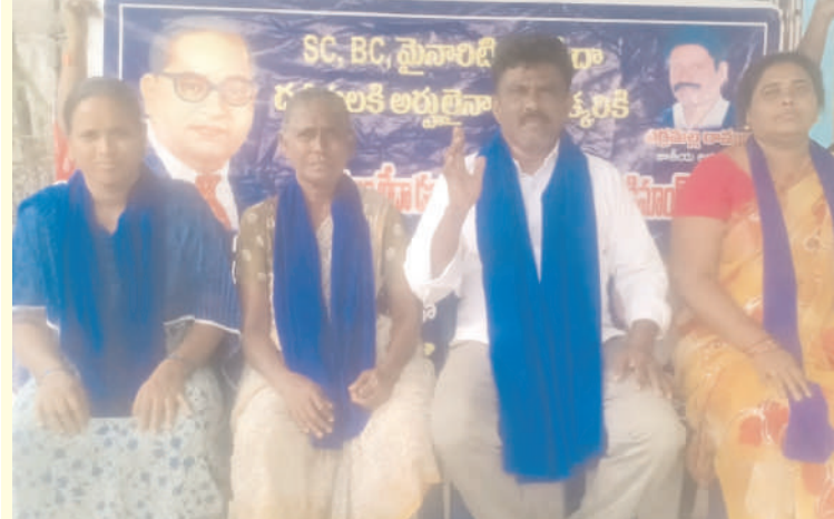
ప్రజా గొంతుక స్టూడెంట్స్/భద్రాద్రి కొత్తగూడెం జిల్లా/ ప్రతినిధి