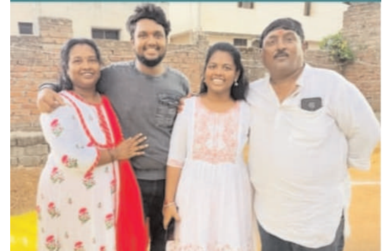
ప్రజా గొంతుక స్టూన్/సుల్తానాబాద్