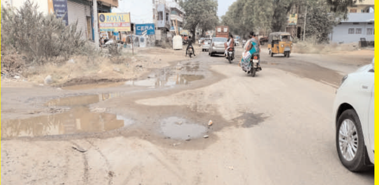
పలువులు వాహన దారులు ఆవేదన వ్యక్తం చేస్తున్నారు, ఇప్పటికైనా ఈ సమస్యపై పై అధికారులు స్పందించి త్వరగా తీర్చిదిద్దాలని వాహనదారులు కోరారు.