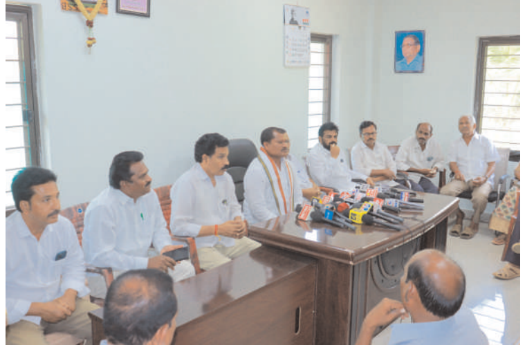
ప్రతినిధులు తదితరులు పాల్గొన్నారు.