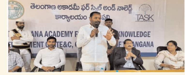
చైర్మన్, మున్సిపల్ కౌన్సిలర్స్, టాస్క్ సభ్యులు ప్రభుత్వ అధికారులు మరియు విద్యార్థులు తదితరులు పాల్గొన్నారు.