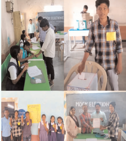
మీకు రాజీయే ఓటు హక్కు ను సక్రమంగా, సరైన విధానంలో