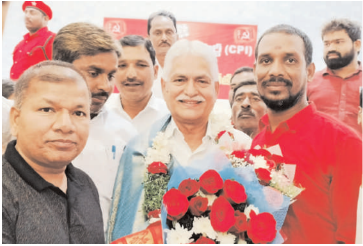
ప్రజా గొంతుక : శంషాబాద్