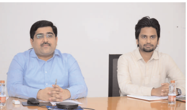
-జిల్లా ఎన్నికల అధికారి, కలెక్టరు హనుమంతు