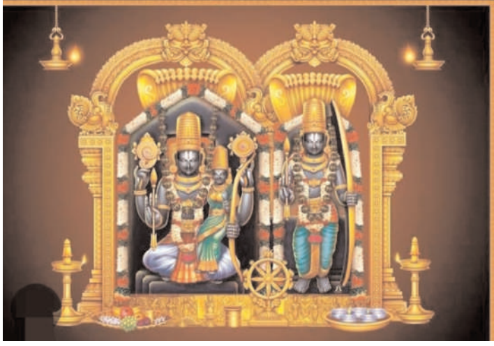
ప్రజా గొంతుక స్వాస్థ్య/భద్రాద్రి కొత్తగూడెం జిల్లా/ ప్రతినిధి