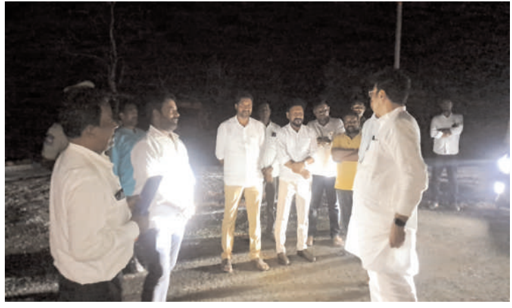
భారీ వాహనాలు ఎలాంటి ఆటంకం లేకుండా వెళ్లే విధంగా ఏర్పాటు చేయాలన్నారు. రహదారి నిర్మాణ పనుల్లో నాణ్యత పాటించాలని సంబంధిత కాంట్రాక్టర్ ను ఆదేశించారు

మంథని - కాటారం ప్రధాన రహదారిపై ఆరెండ్ గ్రామ మూలములుపై పెద్దగా వెడల్పు చేయాలని సంబంధిత అధికారులను కాంట్రాక్టర్ ను ఆదేశించిన ఐటీ పరిశ్రమల శాఖ మంత్రి దుద్దిల్ల శ్రీధర్ బాబు మల్లర్ రావు మండల పర్వత అనంతరం మంథని పట్టణానికి తిరిగి వస్తున్న సమయంలో ఆరెండ్ మూలములుపై వద్ద రహదారి నిర్మాణ పనులను ఆయన పరిశీలించారు.ఆదివారం పేట నుండి అడవి సోమనపల్లి వరకు 45 కోట్ల నిధులతో చేపట్టిన రహదారి పనులను ఆయన పరిశీలించారు.రహదారి నిర్మాణ పనులను చేపట్టిన కాంట్రాక్టర్ ను వివరాలు అడిగి తెలుసుకున్నారు.త్వరోలో వెంకటాచార్య నుండి దామరకుంట మధ్య ప్రజల సౌకర్యార్థం మధ్యలో వంతెన నిర్మాణం చేపట్టడానికి ప్రణాళికలు రూపొందిస్తున్నామని తెలిపారు.ఆరెండ్ మూలములుపై వద్ద విశాలంగా రహదారిని విస్తరించాలని కాంట్రాక్టర్ కు, ఆర్ ఆండ్ బి ఈ ఈలకు నూచనలు చేశారు.మధ్యలో ఓ కూడలిని ఏర్పాటు చేయాలని, గ్రీనరీ ని ఏర్పాటు చేసే విధంగా రహదారి మధ్యలో సుందరీకరణ పనులు చేపట్టాలని సూచించారు. మూలములుపై వద్ద ట్రాఫిక్ కు ఇబ్బందులు కలగకుండా దూరం నుండి డివైడర్లను విశాలంగా నిర్మించాలని సూచించారు.