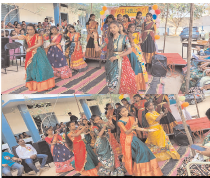
మనోహరాబాద్ 14మార్చి (ప్రజా గొంతుక)