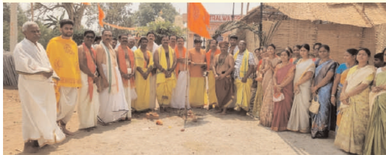
ప్రజా గొంతుకు గద్వాల టౌన్.....