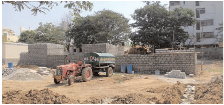
క్రింది స్థాయి అధికారులు చెప్పినా

వినని వైసెంపిం చేసుకుంటారో చేసుకోండి అని అధికారుల పై బరితెగింపు