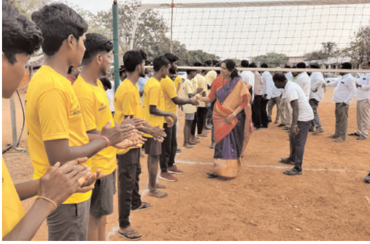
క్రీడాకారులతో సరదాగా ఆడిన జెడ్పీటీసీ సభ్యురాలు!