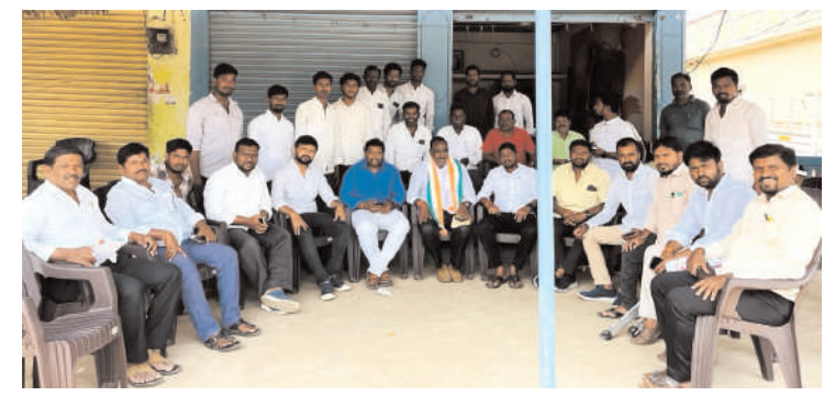
షాద్ నగర్/ప్రజా గొంతుక ప్రతినిధి