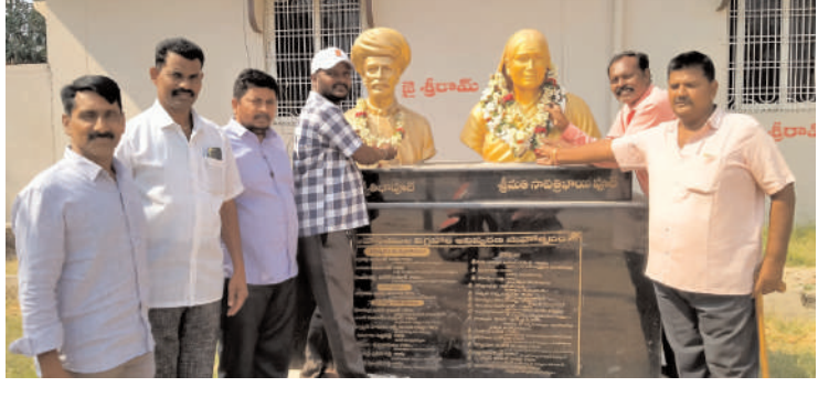
ప్రజా గొంతుక స్యూస్ // భీమవేదవరల్లి