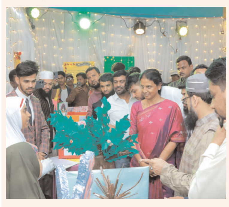
ప్రజా గొంతుకు// ప్రతినిధి// మహేశ్వరం// మార్చి 10 మహేశ్వరం నియోజకవర్గం లోని జలవల్లి మున్సిపాలిటీ కాలనీ లో సైన్ మోడల్ సూట్ వారి ఆధ్వర్యంలో ఏర్పాటుచేసిన సైన్స్ ఎగ్జిబిషన్ కార్యక్రమంలో పాల్గొని విద్యార్థుల కనబరిచిన ప్రతిభను చిన్నారలని అభినందించిన మాజీ మంత్రివర్గులు, మహేశ్వరం ఎమ్మెల్యే శ్రీమతి సబితా ఇంద్రారెడ్డి . ఈ కార్యక్రమంలో జలవల్లి మున్సిపాలిటీ చైర్మన్ వైస్ చైర్మన్ మరియు సైన్ మోడల్ సూట్ చైర్మన్ వైస్ చైర్మన్ మరియు ఉపాధ్యాయులు మరియు కౌన్సిలర్లు మొదలగు తదితరులు పాల్గొన్నారు.