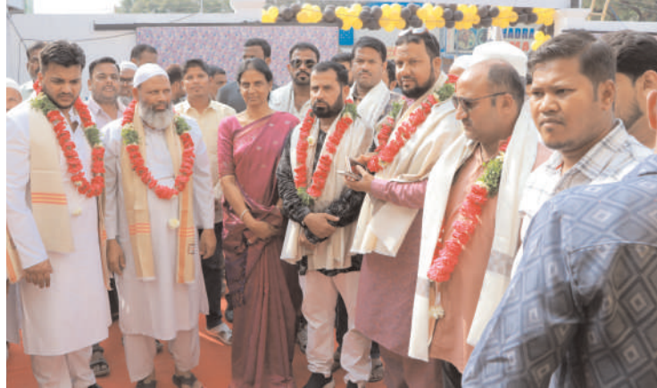
ప్రజా గొంతుక // ప్రతినిధి// మహేశ్వరం// మార్చి 10