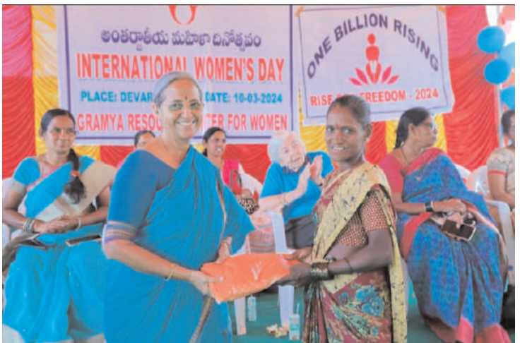
ప్రజా గొంతుక ప్రతినిధి,డిండి:

అంతర్జాతీయ మహిళా దినోత్సవం సందర్భంగా గ్రామ్య సంస్థ ఆధ్వర్యంలో దేవరకొండ నియోజకవర్గం లో ఆరు మండలాల సుండి సుమారుగా 200 మంది మహిళలు కిక్ కిర బాలికలు హాజరు కావడం జరిగింది...%