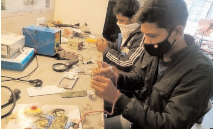
ప్రజా గొంతుక స్కూల్స్ రాయికల్