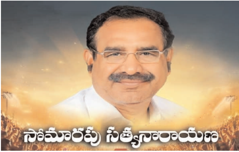
సామాజిక సేవల సమన్వయకర్త