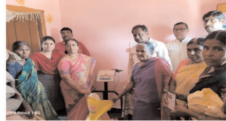
కల్వకుర్తి ఫిబ్రవరి 5 ప్రజా గొంతుక ప్రతినిధి పార్టీ