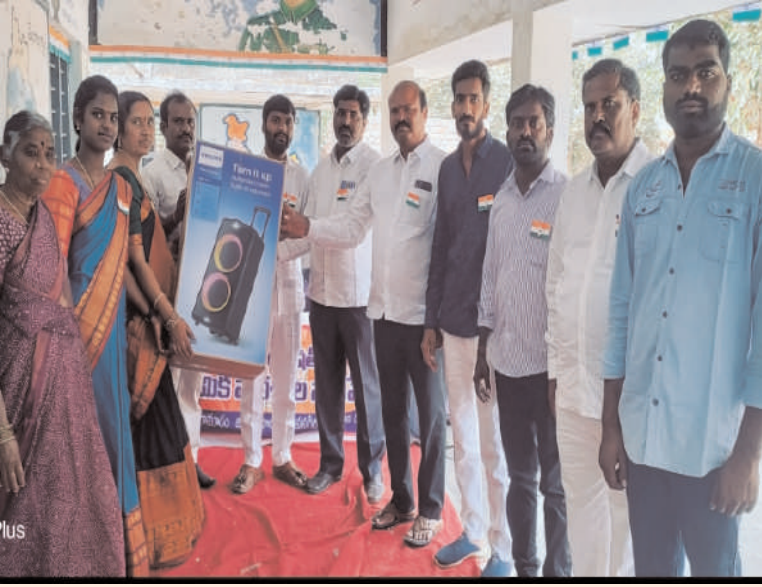
ప్రజా గొంతుక/ఆలేరు నియోజకవర్గం ప్రతినిధి/ బొమ్మలరామారాం