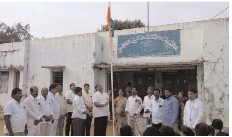
ప్రజా గొంతుక /బచ్చన్నపేట మండలం: