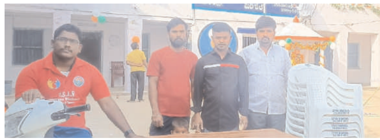
2006-2007 సంవత్సర పడవ తరగతి బ్యాచ్