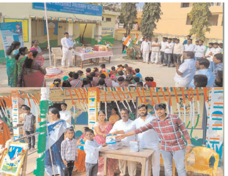
మనోహరాబాద్ 26జనవరి(ప్రజా గొంతుక)

మెడక్ జిల్లా మనోహరాబాద్ మండలంలో 75వ గణతంత్ర దినోత్సవం సందర్భంగా మండల పరిధిలోని ప్రభుత్వ ప్రైవేట్ కార్యాలయాలలో శుక్రవారం గణతంత్ర దినోత్సవ వేడుకలను ఘనంగా నిర్వహించారు. ప్రభుత్వ ప్రైవేట్ కార్యాలయాలు, పాఠశాలలు, గ్రామ పంచాయతీ కార్యాలయాలతో పాటు, అనుబంధ సంఘాలు గణతంత్ర దినోత్సవాన్ని పురస్కరించుకొని జాతీయ నాయకులు మహాత్మా గాంధీ, అంబేద్కర్ చిత్ర పటాలకు పూలమాలలు వేసి మువ్వన్నెల జెండాను ఎగరవేశారు. స్వీట్లు పంపిణీ చేసి, ఒకరికొకరు గణతంత్ర దినోత్సవ శుభాకాంక్షలు తెలుపుకున్నారు. మండలంలోని దండుపల్లి, కోనాయిపల్లి గ్రామాలలోని ప్రైవేట్ పాఠశాలలో జరిగిన గణతంత్ర దినోత్సవంలో విద్యార్థులు వివిధ రకాల వేషధారణలో చూసేవారికి ఆనందం కలిగేలా నృత్యాలు, నాటికలు వేసారు. అనంతరం గణతంత్ర దినోత్సవం సందర్భంగా నిర్వహించిన క్రీడల్లో గెలుపొందిన వారికి బహుమతులను అందజేశారు. ఈ వేడుకలలో ప్రజాప్రతినిధులు, వివిధ పార్టీల సంఘాల నాయకులు, అధికారులు, గ్రామస్థులు, తదితరులు పాల్గొన్నారు.