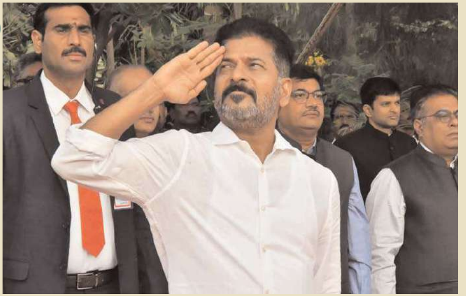
గణతంత్ర దినోత్సవం సందర్భంగా తెలంగాణ గవర్నర్ తమిళ సై సాందర్ రాజన్ ఆసక్తికర వ్యాఖ్యలు చేశారు. గత ప్రభుత్వ హయాంలో జరిగిన తప్పిదాలను ఎత్తి చూపారు. "పదేళ్ల బీఆర్ఎస్ పాలనలో రాష్ట్రంలో రాజ్యాంగ విలువలు విధ్వంసానికి గురయ్యాయన్నారు. ప్రజా ప్రభుత్వంలో వాటిని నిర్మించుకుంటున్నాం.