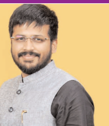
కాకుండా నెం.1 మున్సిపాలిటీగా తీర్చిదిద్దతానని ఆయన హామీనిచ్చారు.

- మెడక్ మున్సిపాలిటీని రాష్ట్రంలో ప్రత్యేక మున్సిపాలిటీగా తీర్చిదిద్దతాం - మెడక్ నియోజక వర్గ ఎమ్మెల్యే డా. మైసంపల్లి రోహిత్ మెడక్ ప్రజా గొంతుకు స్యూస్ మార్పు మొదలైంది... నిజంగానే మార్పు మొదలైందని మెడక్ బల్లియాలోని పాఠశాలలోని ఎదురుగా ఉన్న మున్సిపల్ దుకాణాల యాక్సెస్ తో మెడక్ పట్టణంలో 10 ఏండ్ల తరువాత మెడక్ బల్లియా కు ఖజానాను సృష్టించిన ఘనత మెడక్ నియోజక వర్గ ఎమ్మెల్యే డా. మైసంపల్లి రోహిత్ కు దక్కిందని నియోజక వర్గ ప్రజలతో పాటు మెడక్ మున్సిపల్ అధికారులు మాట్లాడుకోవడం మెడక్ నియోజక వర్గంలోని ప్రజలు సంతోషం వ్యక్తం చేస్తున్నారు. మెడక్ పట్టణంలోని మున్సిపల్ దుకాణాల యాక్సెస్ గతంలో ఎన్నడూ లేని విధంగా కాంగ్రెస్ ప్రభుత్వం అధికారంలోకి రావడమే కాకుండా మెడక్ నియోజక వర్గ ఎమ్మెల్యే డా. మైసంపల్లి రోహిత్ గెలుపొందడంతో మెడక్ మున్సిపల్ లో 10 ఏండ్లుగా లేని ఆధాయాన్ని ఒకే సారి భారీ ఖజానాను సమకూర్చడం విశేషం అనిపలుపుచున్నందుకంటున్నారు. ఈ సందర్భంగా మెడక్ నియోజక వర్గ ఎమ్మెల్యే మైసంపల్లి రోహిత్ మాట్లాడుతూ గతంలో ఎన్నడూ లేని విధంగా మున్సిపాలిటీకి కేవలం 17 దుకాణాల సముదాయల నుంచి దాదాపు నెలకు 5 లక్షల రూపాయలు రావడం సంతోషకరం అని ఆయన అన్నారు. అంతే కాకుండా ఈ ఆధాయాన్ని ప్రజలకు ఉపయోగపడేలా చర్యలు తీసుకుంటానని ఆయన పేర్కొన్నారు. రాష్ట్రంలోనే మెడక్ మున్సిపాలిటీ ప్రత్యేక మున్సిపాలిటీగా తీసుకురావడమే