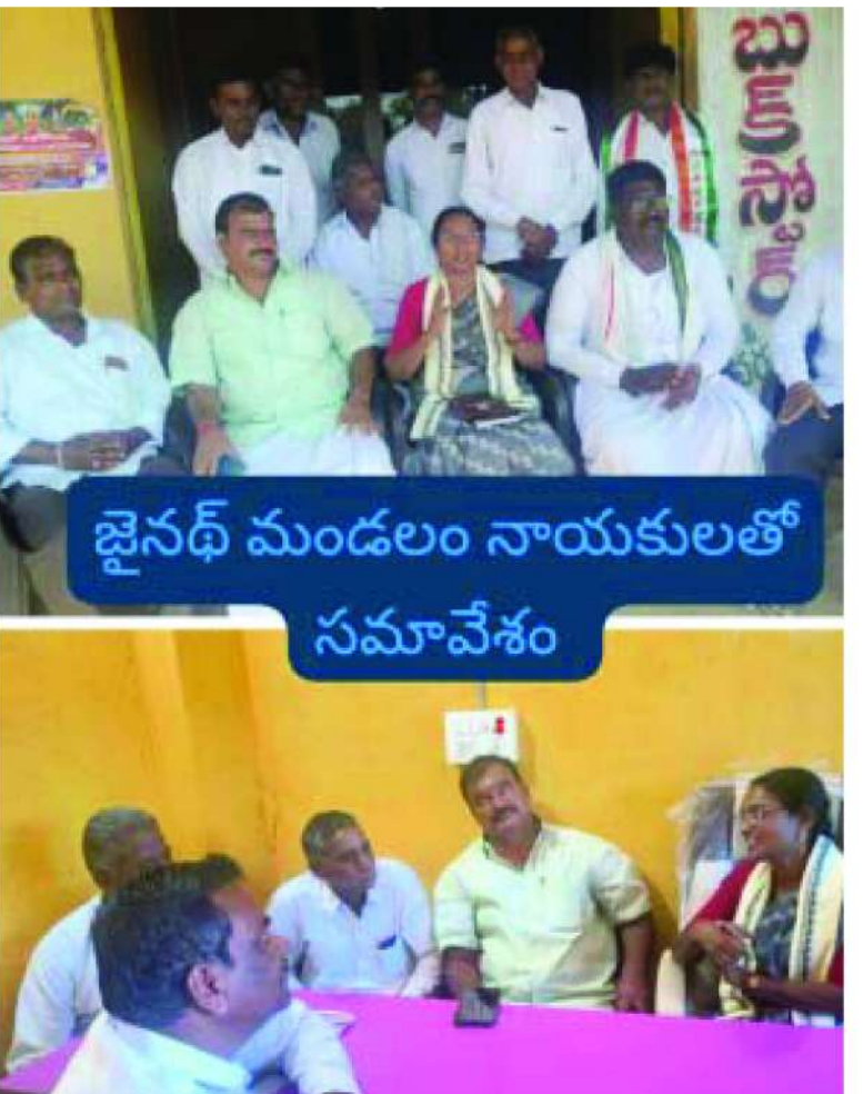
జైనాథ్ మండలం నాయకులతో సమావేశం

నా కల నెరవేరాలంటే అదిలాబాద్ పార్లమెంట్ పరిధిలో గల అన్ని గ్రామాలను అభివృద్ధి చేయడమేనని, నా లక్ష్యాన్ని నెరవేరాలంటే కాంగ్రెస్ నేతలు అంతా సహకరించాలని ఆత్మం సుగుణ కోరారు.బుధవారం అదిలాబాద్ పార్లమెంట్ నియోజకవర్గం మండలాల పర్యటనలో భాగంగా మధ్యాహ్నం జైనాథ్ మండల కేంద్రంలోని కాంగ్రెస్ పార్టీ నాయకులతో, కార్యకర్తలతో భేది అయ్యారు. ఈ సందర్భంగా ఆమె మాట్లాడుతూ అదిలాబాద్ పార్లమెంట్ ఎంపీ బిల్లో ఉన్నానని వెల్లడించారు. తనకు కాంగ్రెస్ పార్టీ నుండి డిజిల్ వచ్చి తనని పార్లమెంట్ సభ్యురాలిగా గెలిపిస్తే అదిలాబాద్ పార్లమెంటు నియోజకవర్గాన్ని అన్ని రంగాలలో అభివృద్ధి చేస్తానని అన్నారు. తనకు ఈ నియోజకవర్గంలోని అన్ని గ్రామాల్లో గల సమస్యలు తన దృష్టిలో ఉన్నాయని వాటన్నింటినీ తీర్చినట్లుంటే ఈ నియోజకవర్గంలో అన్ని రంగాలలో అభివృద్ధి చెందింబుండుకు వెళ్తుందన్నారు. ఈ కార్యక్రమంలో జైనాథ్ మండల కాంగ్రెస్ పార్టీ నాయకులు, కార్యకర్తలు, కాంగ్రెస్ పార్టీ అభిమానులు తదితరులు పాల్గొన్నారు..