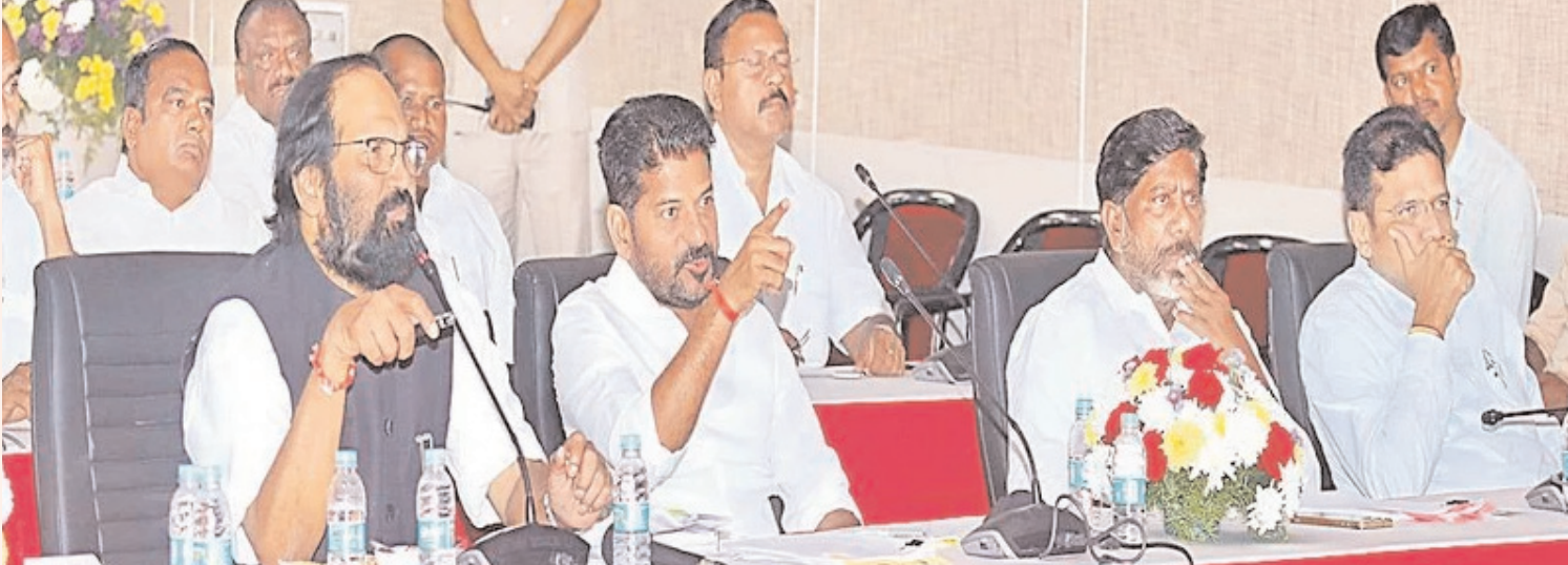
లోకసభ ఎన్నికల కోసమే కేసీఆర్..

తెలంగాణ ఆంధ్ర ప్రదేశ్ సంపుటి : 2 బులిటెన్ : 95 (కాంప్లిమెంటరీ కాపీ) 12-2 - 2024 పేజీలు : 14 Digital Edition