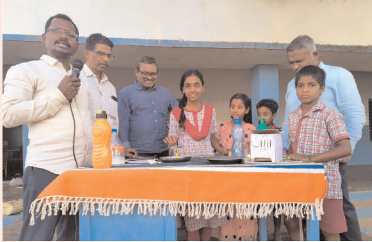
ప్రజా గొంతుక గద్యాల టౌన్.....

చెనుగొనిపల్లి ప్రాథమికోన్నత పాఠశాలలో జాతీయ సైన్స్ దినోత్సవం ను ఘనంగా నిర్వహించారు. విద్యార్థులు ఉపాధ్యాయుల సహకారంతో సైన్స్ ప్రయోగాలు నిర్వహించడం జరిగింది.