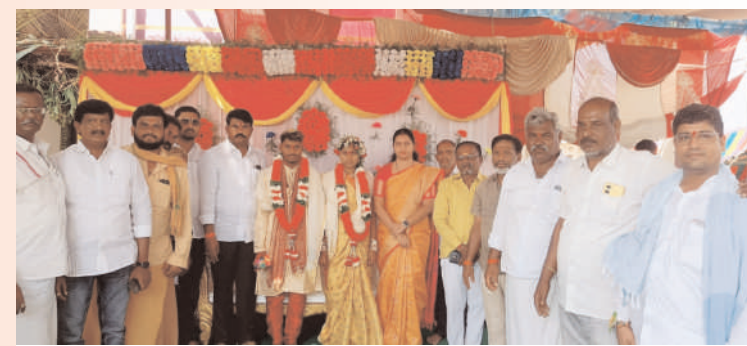
ప్రజా గొంతుక గద్యాల టౌన్.....