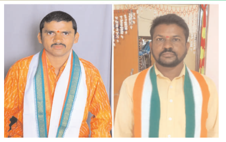
త్వరలోనే రైతు రుణమాఫీ చేసి రైతుల గుండెల్లో కాంగ్రెస్ పార్టీ నిలుస్తుందని అన్నారు.