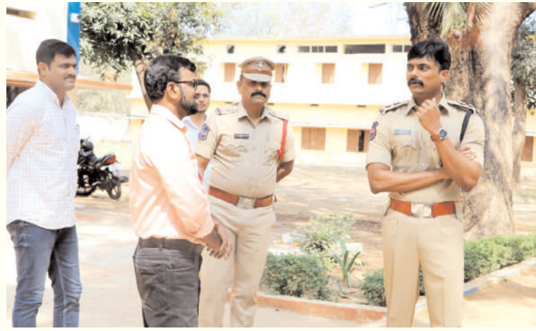
ప్రజా గొంతుక స్పూన్/భద్రాద్రి కొత్తగూడెం జిల్లా/ ప్రతినిధి