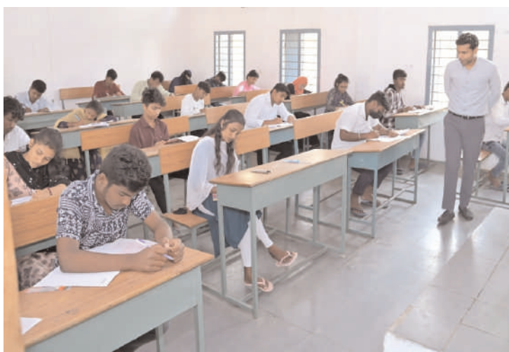
జిల్లా కలెక్టర్ వెంట సంబంధిత అధికారులు, తదితరులు పాల్గొన్నారు.

పెద్దపల్లి మున్సిపాలిటీలో ఉన్న ఐదు పరీక్షా కేంద్రాలను జిల్లా ఇంటర్మీడియట్ నోడల్ అధికారిని కల్పన తనిఖీ చేసి ఇంటర్ పరీక్షలు జరిగి తీరును పరిశీలించారు. ఈ పర్యటనలో