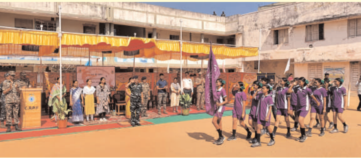
ప్రజా గొంతుక ప్రతినిధి/ దుమ్ముగూడెం