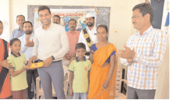
ఆకాడమిక్ ప్రధానోపాధ్యాయులు, సంబంధిత అధికారులు, తదితరులు పాల్గొన్నారు.