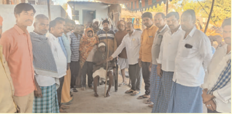
రాజుపేట, ఫిబ్రవరి 17 ప్రజా గొంతుక స్వాస్థ్య భవనగిరి జిల్లా ప్రతినిధి: