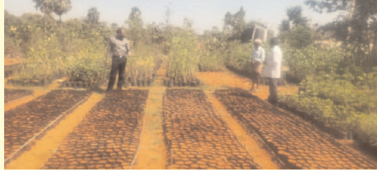
పెద్దపంగర ఫిబ్రవరి 17(ప్రజా గొంతుక)

పెద్దపంగర మండలం లోని చిన్నపంగర మరియు బావోజ్ శంధా గ్రామపంచాయతీల పంచాయతీ కార్యదర్శి మరియు పీల్డ్ అసిస్టెంట్ ల తో పాటు నర్సరీలను సందర్శించారు.