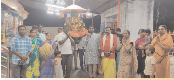
ప్రజా గొంతుక గద్వాల టౌన్

గద్వాల పట్టణ సమీపంలోని నది అగ్రహారం వద్ద గల శ్రీ కళ్యాణ లక్ష్మి వెంకటేశ్వర స్వామి వారి పల్లకి సేవను ఘనంగా నిర్వహించారు.