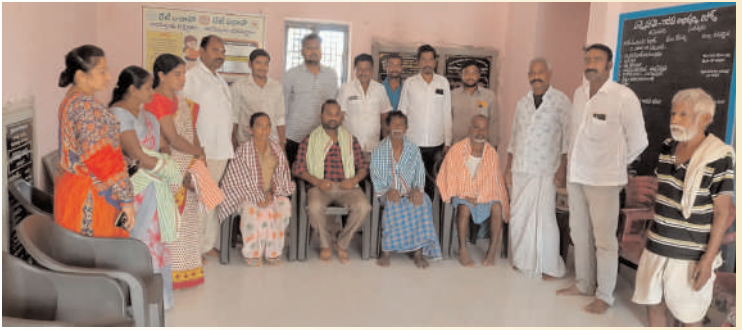
ప్రజా గొంతుక ప్రతినిధి, కోర్లజ్జ