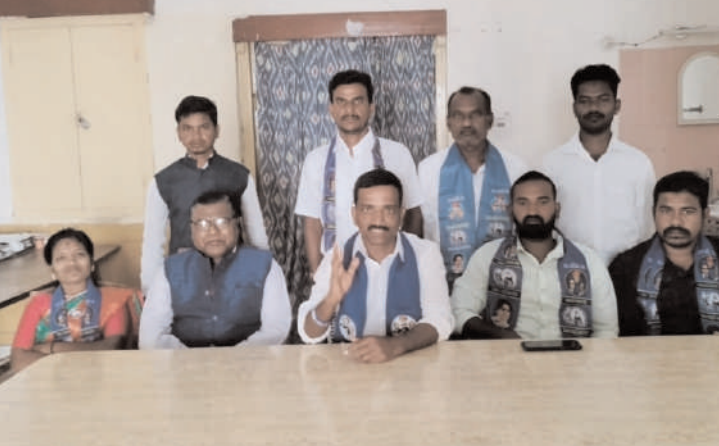
యాదాద్రి భువనగిరి జిల్లా ఫిబ్రవరి 15 ప్రజా గొంతుక ప్రతినిధి