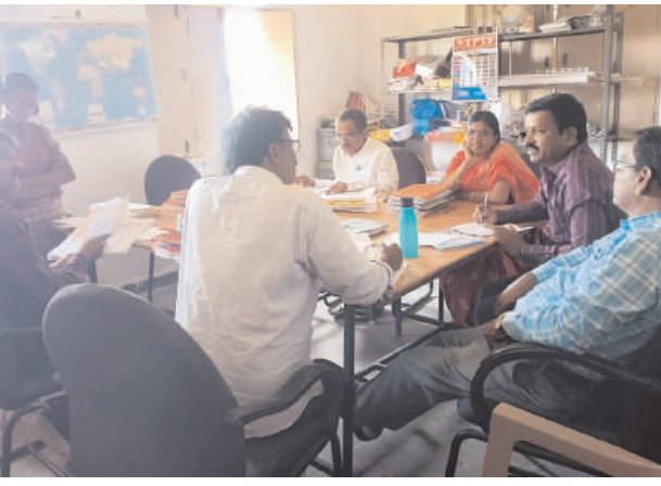
పాల్గొంటున్నప్పుడు,బోధన జరుగుతున్నప్పుడు విద్యార్థి ఏ