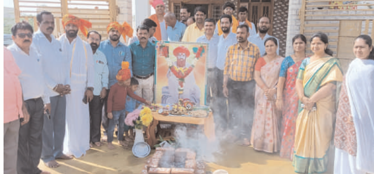
ప్రజా గొంతుకు ప్రతినిధి/జనగామ: