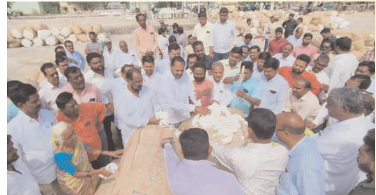
ప్రజా గొంతుక పెద్దపల్లి :

పెద్దపల్లి పట్టణంలోని వ్యవసాయ మార్కెట్ లో గురువారం పత్తి కొనుగోలు విషయంలో రైతులకు ఎలాంటి సమస్యలు రాకుండా పత్తిని కొనుగోలు చేయాలని, మార్కెట్ లో ఉన్న పత్తిని పరిశీలించి అధికారంతో మరియు అధిదారులతో మాట్లాడి తొందరగా రైతుల పత్తిని కొనుగోలు చేసేలా చర్యలు తీసుకోవాలని అలాగే రైతులకు సరైన పంటలు పండించేలా అవగాహన చేయాలని సంబంధిత అధికారులను తెలియజేసి పెద్దపల్లి శాసనసభ్యులు చింతకుంట విజయరమణ రావు ఈ కార్యక్రమంలో వ్యవసాయ మార్కెట్ అధికారులు, ప్రజాప్రతినిధులు, కాంగ్రెస్ పార్టీ నాయకులు, కార్యకర్తలు, రైతులు తదితరులు పాల్గొన్నారు.