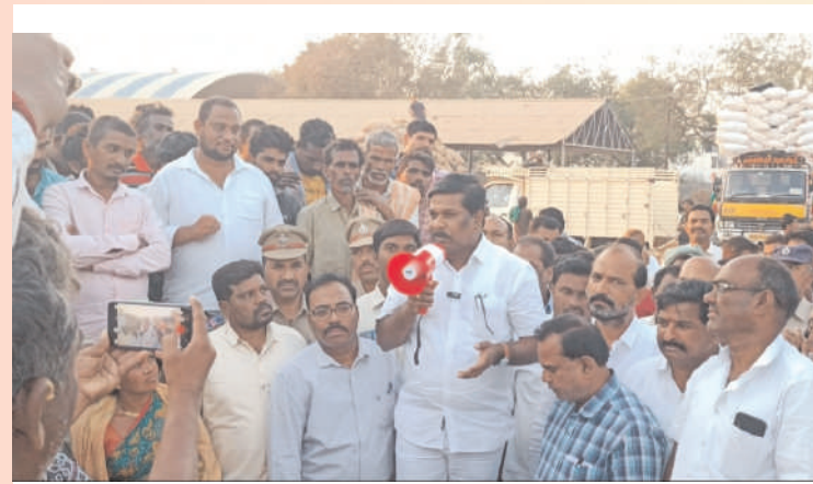
ప్రజా గొంతుక స్యూస్ ప్రతినిధి / అచ్చంపేట

రైతులకు న్యాయం చేస్తాము : ఎమ్మెల్యే డాక్టర్ వంశీకృష్ణ