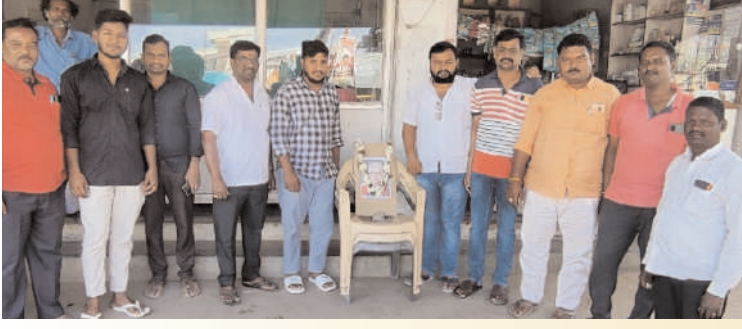
ప్రజా గొంతుక ప్రతినిధి డిండి