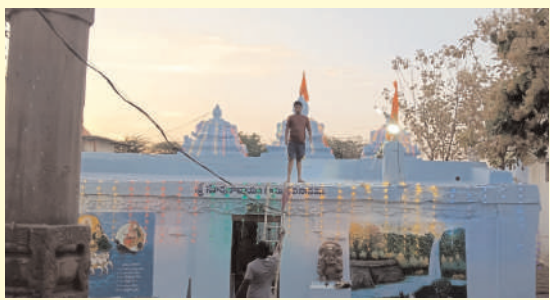
ప్రజా గొంతుక గద్వాల టౌన్ అలంపూర్