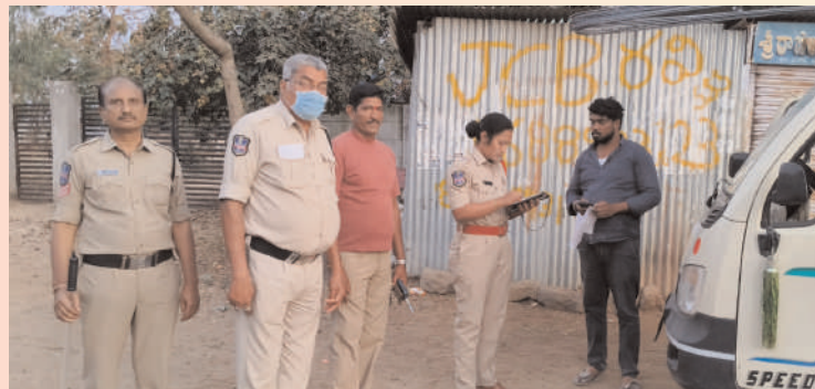
తరిగొప్పుల, ప్రజా గొంతుక స్యూస్

రోడ్డు నిబంధనలు పాటించాలి సబ్ ఇన్స్పెక్టర్ శ్వేత