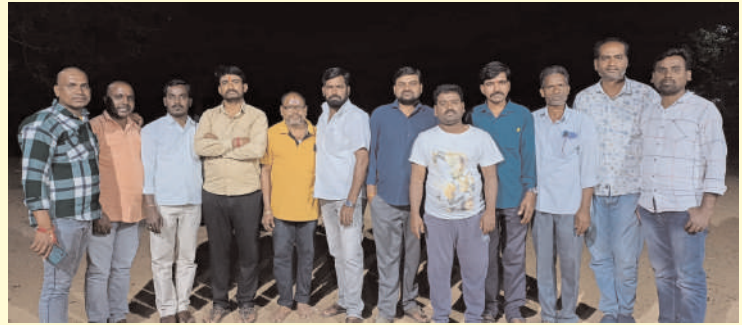
పాపన్నపేట ప్రజా గొంతుక స్యూస్